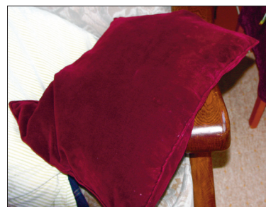
Padi pärast puhastamist.