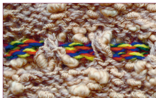
Pael sobib kingipaki ümber ... ja kaunistama ka kudumit.

hästi sobib võtmekimp) ning ühe käega paela otsast kinni hoides laske võtmekimp rippuma ning keeruduma. Kui keerlemine on lõppe-