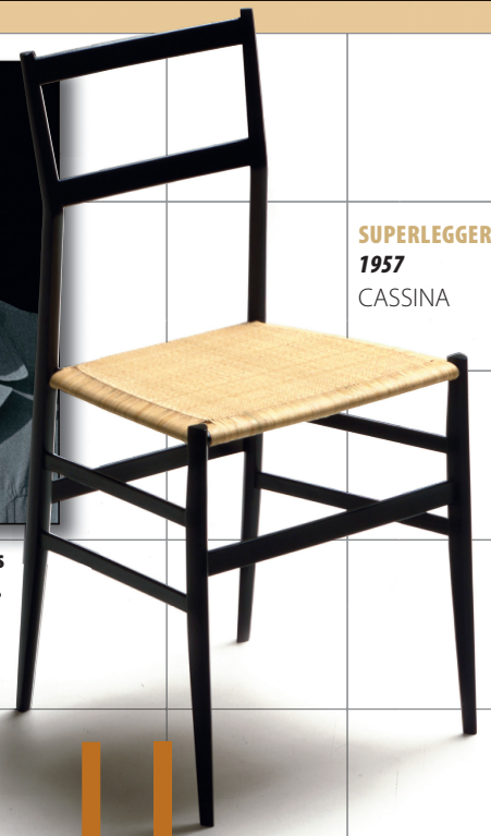
SUPERLEGGERA 1957 CASSINA