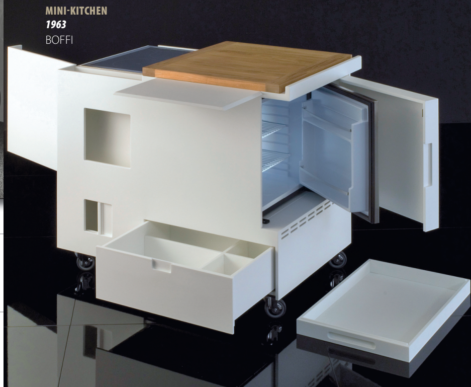
MINI-KITCHEN 1963 BOFFI

Joe Colombo (1930–1971) CVst võib leida kaks Compasso d'Oro auhinda. 1950ndate algul liitus koos Enrico Baj'ga poliitilise tuumasõjavastase maalikunstnike grupeeringuga.