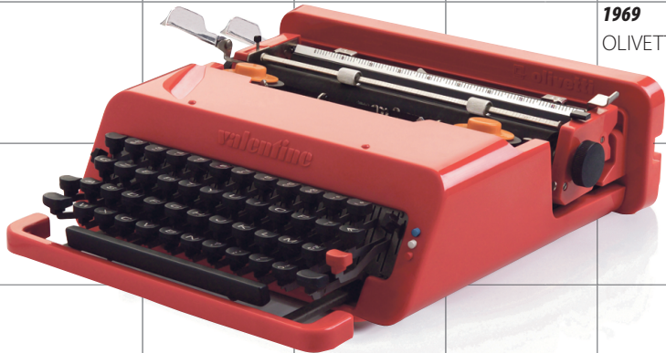
VALENTINE 1969 OLIVETTI

Ettore Sottsass (1917–2007) on neljakordne Itaalia tähtsaima tööstusdisainiauhinna Compasso d'Oro võitja. 1981. aastal lõi ta loomingulise disainerite liidu Memphis.