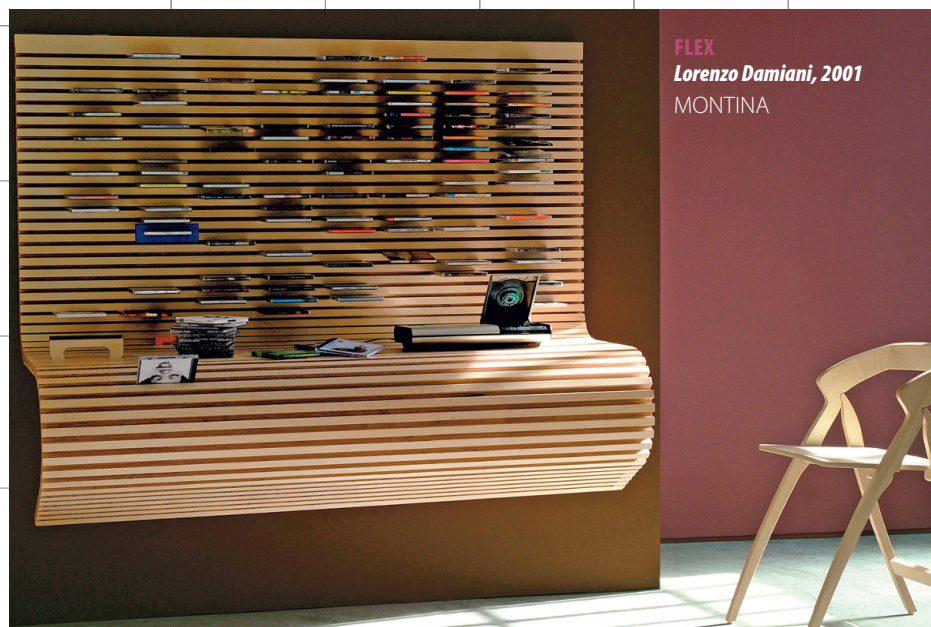
FLEX Lorenzo Damiani, 2001 MONTINA