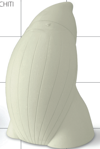
NANO BADDY Joe Velluto, 2008 PLUST COLLECTION