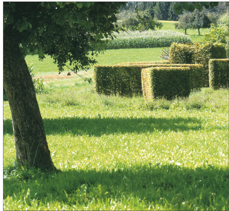
Formaalse kujundusega aed haakub orgaaniliselt ümbritseva loodusega.

Algul pidas peremees hariliku valgepöögi ( Carpinus betulus ) kasutamist igavaks. Kaalumisel oli ka püksipuu, kuid peale jäi valgepöök kui kodumaine taim, kes sellesse maakohta paremini sobib. Ta kasvab kompaktselt ja on vormilõikusega hästi kujundatav.