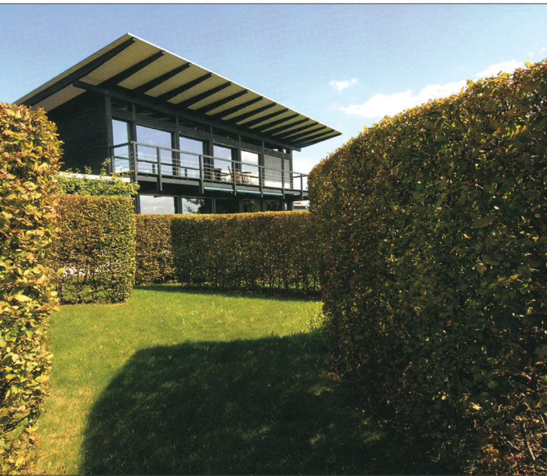
Valguse ja varju vaheldumine loob päeva jooksul erinevaid meeleolusid.

Selles Šveitsi aias pole lillepeenraid ega tara, see seostub sujuvalt ümbritseva maastikuga. Kujunduselemendid on vaid valgepöögist hekigrupid, mis loovad valguse- ja varjualasid, ühendavad ja jaotavad.