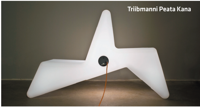
Triibmanni Peata Kana