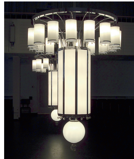
Vellama Peterburi Jaani kiriku lühter