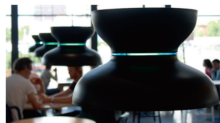
Vellama Lennusadama valgustid