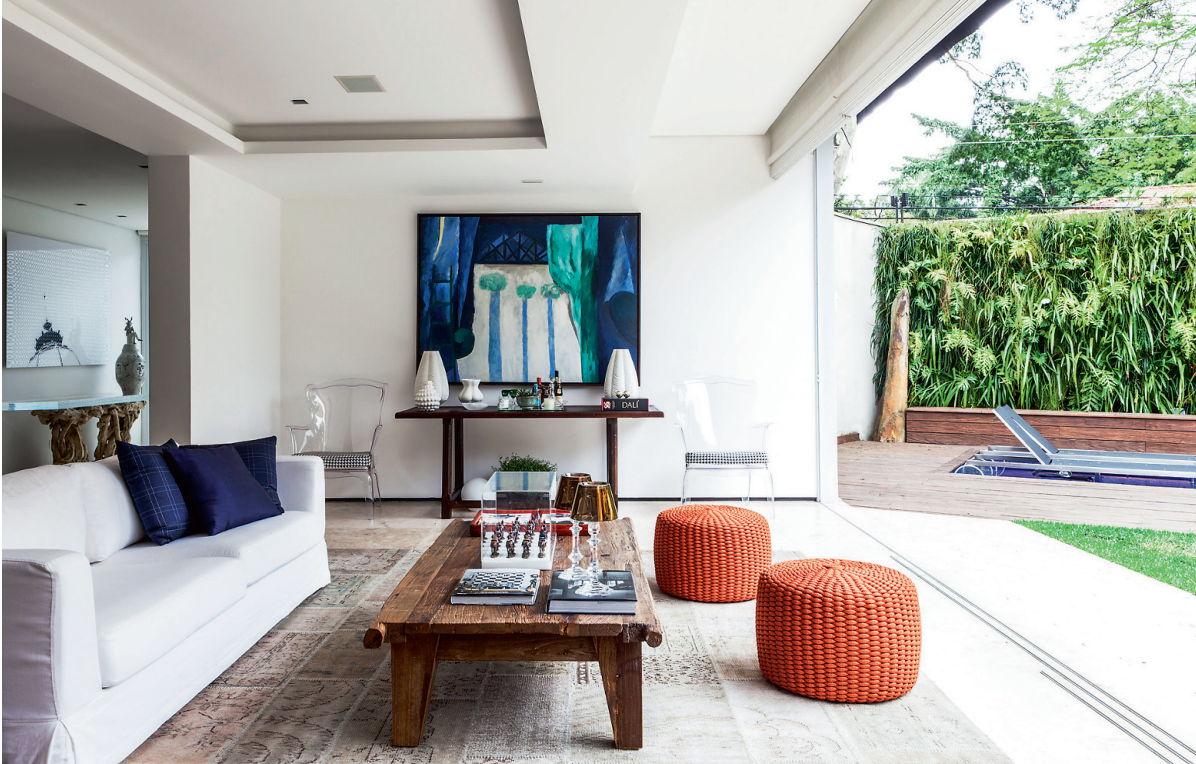
Terrassitoas seisab taaskasutuspuidust diivanilaud.

seinaplaadid. Loobutud on köögi ülakappidest, selle asemel kaunistavad köögiseinu Fornasetti taldrikud.