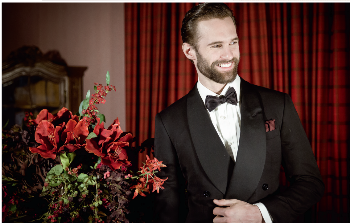
Sellel lehel kannavad kõik modellid Ralph Laureni õhtu-look'i.

ilu ja funktsionaalsuse. Just siin sain ma ennast disainerina nii-öelda välja elada ja sellele suurepärasele paigale oma allkirja anda." Stilistiline pitsar on ökoloogiliste tausta pealt eriti hästi loetav tänu kompleksis kasutatud värvidele, mis sobituvad Peterhofi ümbruskonnaga väga sujuvalt kokku.