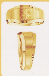
Disain: Raigo Randes

EBSi üliõpilasesindus korraldas 16.–20.veebruari ülikooli sõrmuse disaini valimise. Hääletusel osales ligi sada inimest. Raigo Randese disainitud sõrmustest võitis ülekaalukalt kavand nr 2. Esmakordselt on võimalik EBSi ülikooli sõrmust osta 15. aprillist ruumist 208. Võimalik on näha nii kullast kui ka hõbedast sõrmuste näidiseid. Kullast sõrmuse hind on 2500 krooni (sisaldab 7 grammi kulda) ning hõbedast sõrmuse hind on 399 krooni. Hinnale lisandub graveerimiskulu 5 krooni tähe eest. EBSi ülikooli sõrmus on mõeldud kõigile tudengitele. Edukat tellimist!