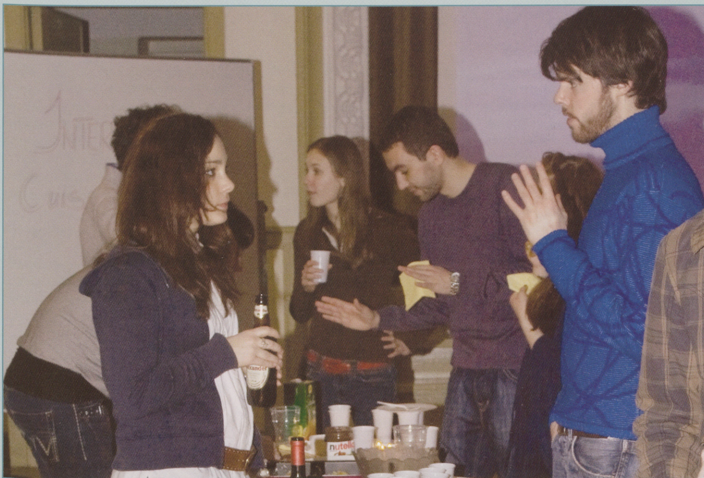
Tasting different national food.