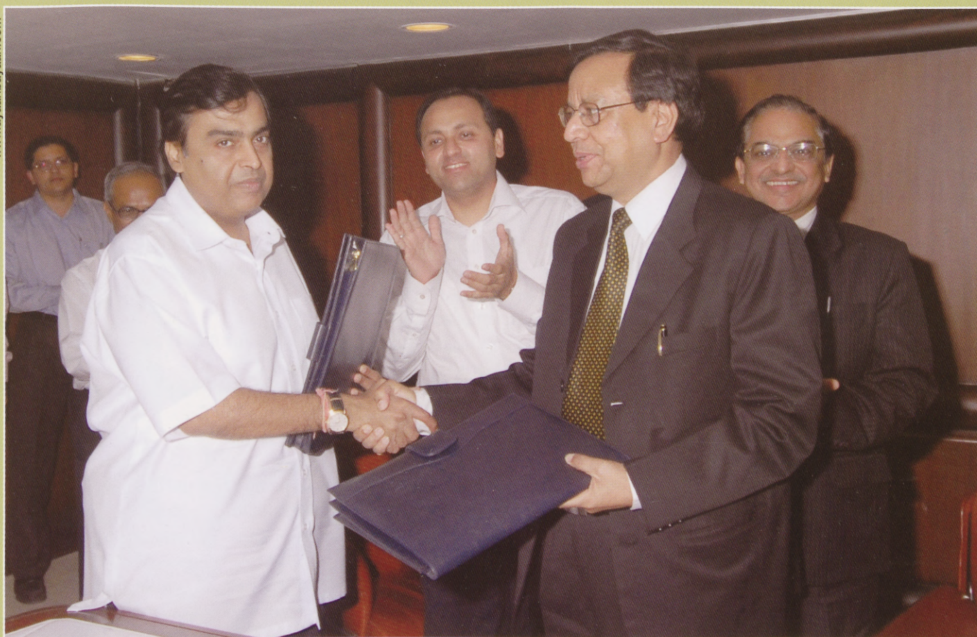
Vasakul Mukesh D. Ambani.

Osa ärimehi ütleb, et Ambani on juba kinistanud end kui India suuremaid muutujaid ning tema pärand on sarnane Ameerika tööstusrevolutsiooni algatajatega 19. sajandil. ■