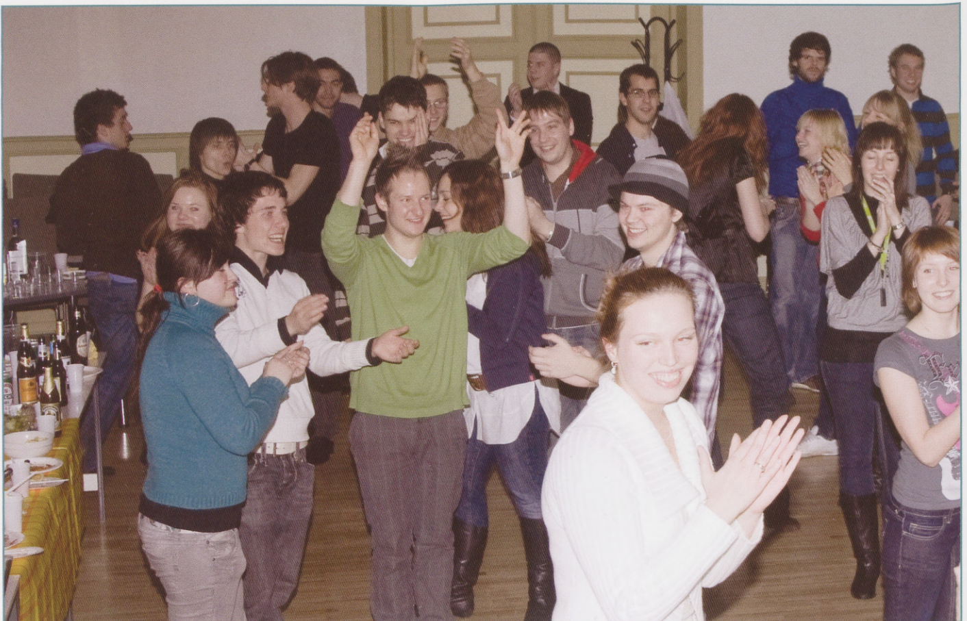
Dancing the Estonian national dance - kaerajaan!

Even though it was Thursday night Erasmus students never sleep. Almost everyone continued their night going out into Old Town with a bunch of new friends and tummy full of delicious food.