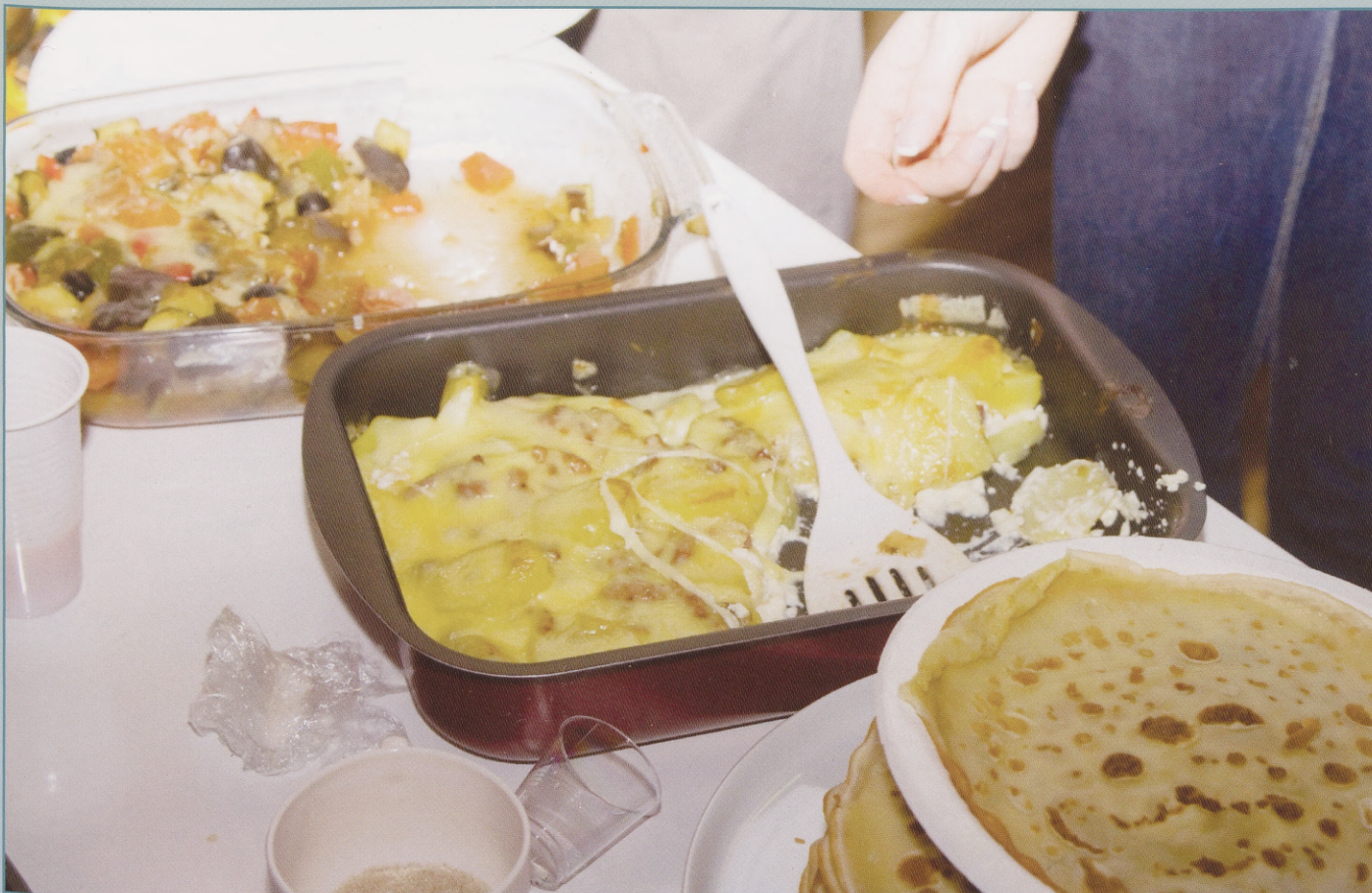
French national food.