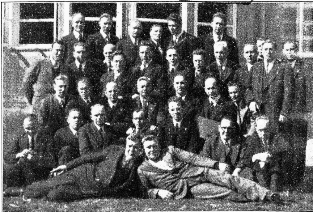
ETL 10-da juubelikongressi saadikud Aegviidu puhkekodu maja ees.