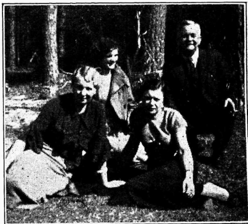
Kolleeg Immoneni lõbus tund.

Mis puutub toidustamisse, siis Liidu juhatus võtab puhkekodusse ökonoomi. Ökonoomiga sõlmitud kokkuleppe kohaselt võib saada sooja lõunatoitu kahe roa eest hinnaga mitte üle 50 sendi. Hommiku ja õhtusöögi kohta tuleb tubade kasutajail ökonoomiga kokkuleppida. Need üürnikud, kes ei soovi kasutada ökonoomi abi, võivad lõunatada ka alevikus söögisaalides. Igal juhtumil ei või üürnikud kasutada puhkekodu kööki toidu valmistamiseks, kui ökonoomiga ei ole tehtud erikokkulepe.