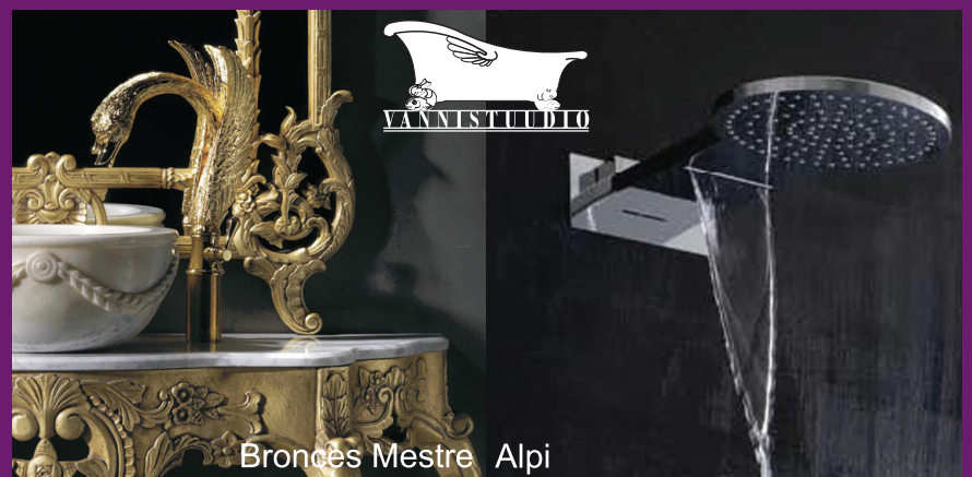
Bronces Mestre Alpi

Vaid murdosa idufirmasid on teadusuuringutele tuginedes midagi täiesti uut teinud. Need on mõnes mõttes just kõige olulisemad firmad, kellest me sageli suurt midagi ei tea, sest nende eesotsas on teadlased, kes ei räägi kogu aeg, kui erilised ja innovaatilised nad on. "Keskmise tootlus idufirmade puhul on väga madal või isegi negatiivne. Raha teenivad väga üksikud, kellel veab või kes on väga targad. See on nagu loteriiaari: seal on üksikuid suuri võitjaid ja palju keskpäraseid kaotajaid. Idufirmasid võib teha, kui oled 25 aastat vana, energiat