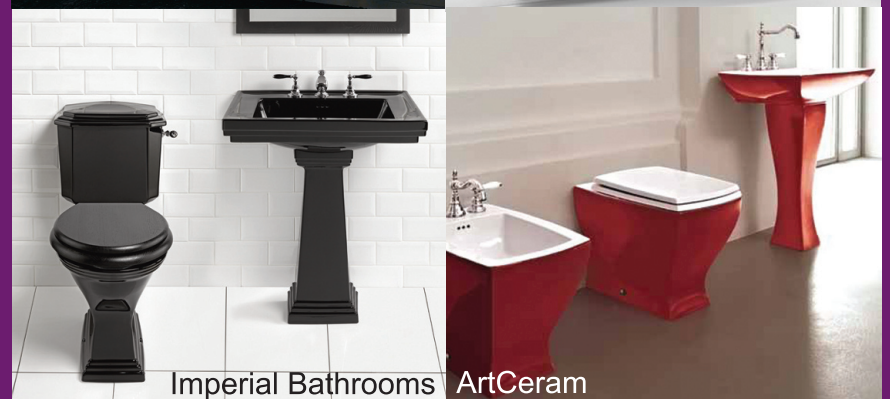
Imperial Bathrooms ArtCeram