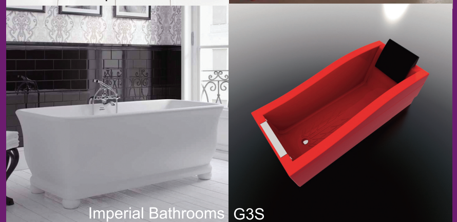
Imperial Bathrooms G3S