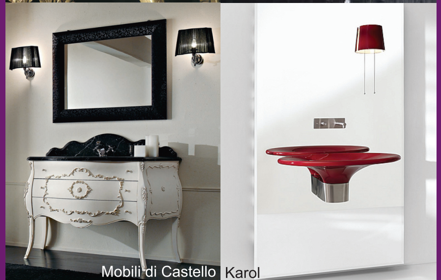
Mobili di Castello Karol