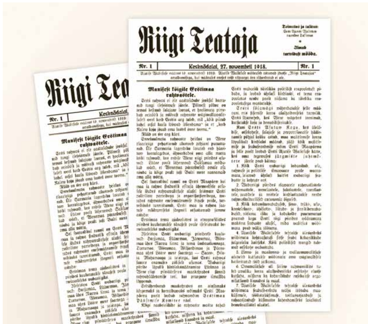
Riigi Teatajal täitus 90 aastat. Riigi Teataja nr 1, milles avaldati Eesti Vabariigi sünnidokumendid, ilmus 27. novembril 1918

Eesti Vabariigi juubeliaasta jooksul avaldati Riigi Teatajas elektrooniliselt üle neljakümne Eesti riikluse rajamist kajastava dokumendi, sealhulgas Maanõukogu otsus kõrgemast võimust, 1918. aasta Riigi Teataja väljaanded ning Tartu rahuleping.