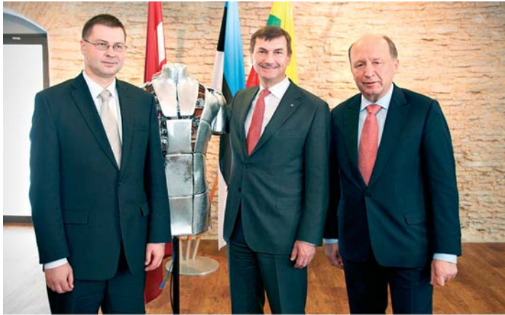
Balti peaministrite kohtumine Vihula mõisas 11. veebruaril 2011