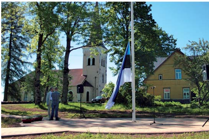
Riigikantselei koostöös Kõpu Vallavalitsusega avas 4. juunil 2011, Eesti lipu 127. sünnipäeval Kõpus lipuväljaku, mis on pühendatud Eesti rahvusliku ärkamisaja ja ühe lipu õnnistaja Villem Reimani 150. sünniaastapäevale