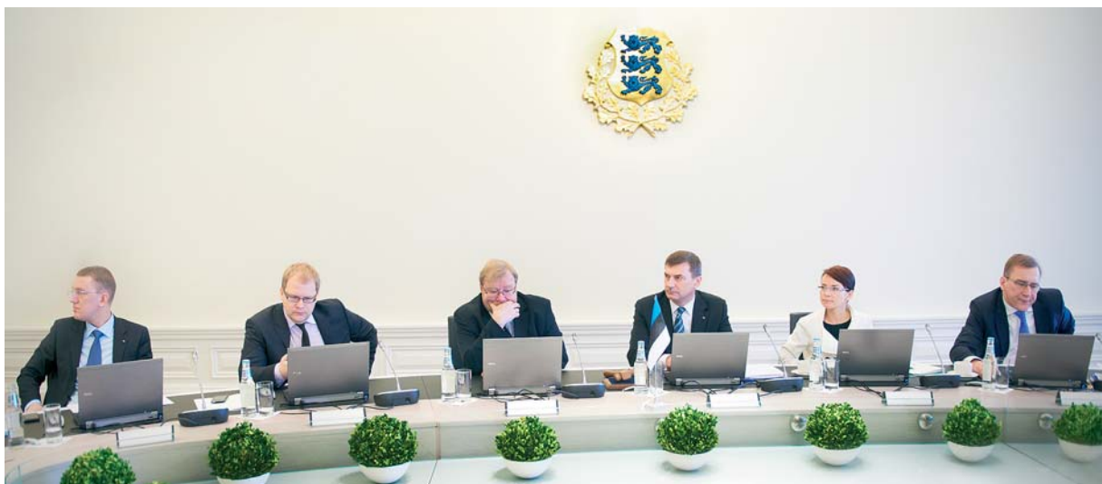
46. Vabariigi Valitsuse esimene istung 7. aprillil 2011

Senisest selgemini on sätestatud koostöö ja kaasamise ning valitsuskommunikatsiooni olulisemad põhimõtted. Uudsenä on reglemendis sätestatud ministeeriumidevaheliste eriarvamuste lahendamise astmeline kord, loodud alus valitsuse määruste andmiseks elektroonilises vormis ning nähtud ette juhiste andmine reglemendi rakendamiseks.