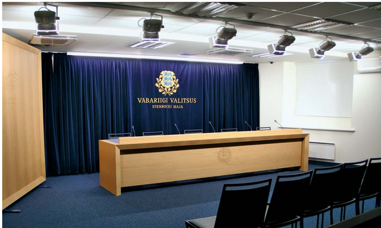
Valitsuse pressikonverentside ruum Stenbocki majas

Koos pressiruumiga muutusid oluliselt kvaliteetsemaks ka videoülekanDED valitsuse pressikonverentsidest. Pärast konverentsi toodab valitsuse kommunikatsioonibüroo olulisematest valitsuse sõnumitest videolugusid, mis pannakse üles valitsuse veebi ning YouTube'i kanalisse.