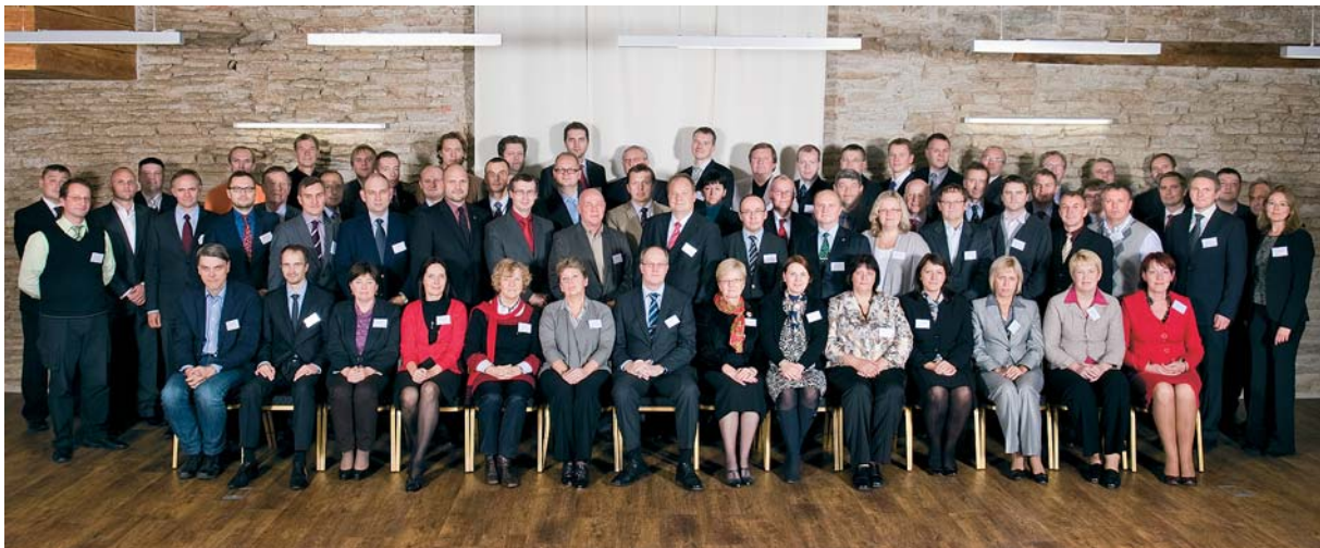
20.-21. oktoobril 2011 toimus Eesti avaliku teenistuse tippjuhtide konverents „Ühtsena valitsemise poole“

Sügisel said valmis ja võeti kasutusele õigus- ja finantsalased valikuülesanded tippjuhiks kandideerija kompetentside hindamiseks.