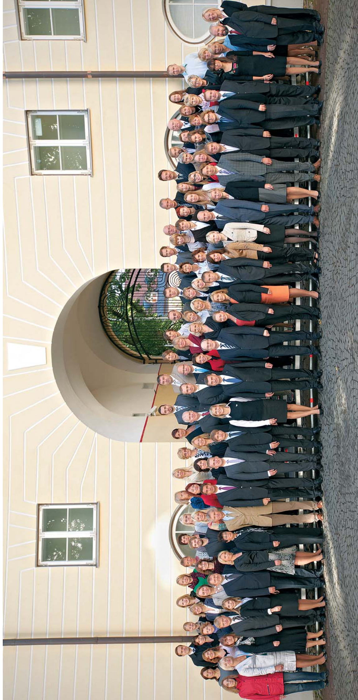
Riigikantsilei töötajad koos peaministriga Stenbocki maja hoovis 20. septembril 2011.