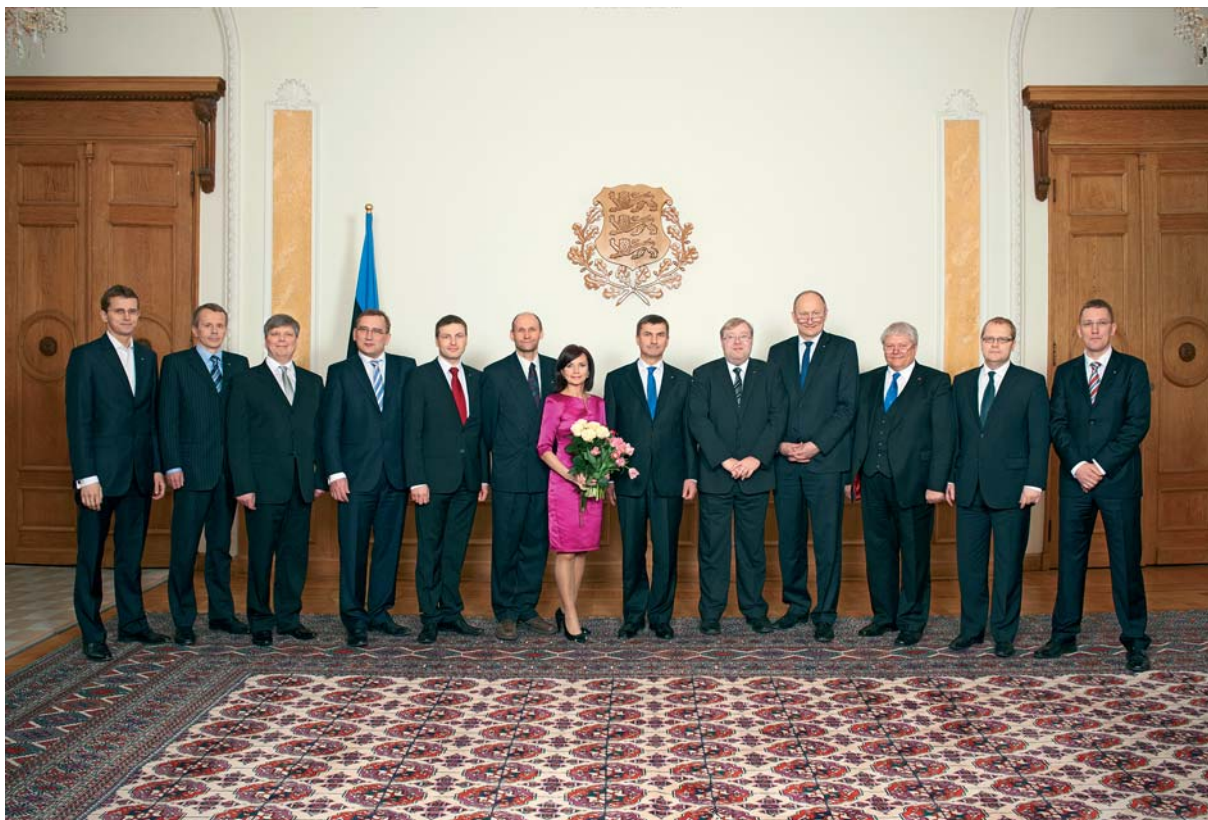
46. Vabariigi Valitsus pärast ametivande andmist Riigikogus, 6. aprillil 2011