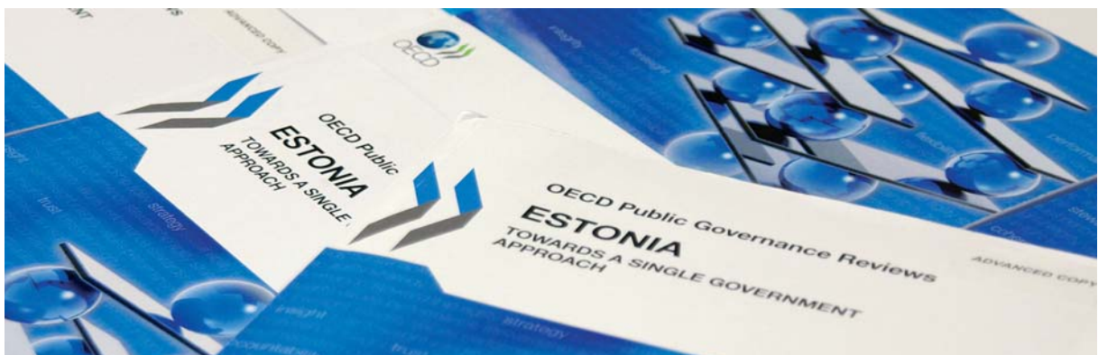
OECD raport „Ühtsema riigivalitsemise poole“

Tegevuskava keskendub ennekõike kolmele laiemale teemale: keskvalitsuse paindlikkuse suurendamisele (valitsuse töökorralduse paindlikkus, avaliku teenistuse arendamine, tugiteenuste tsentraliseerimine), valitsuse strateegiliste eesmärkide selgemale kindlaksmääramisele ja tõhusamale elluviimisele ning avalike teenuste efektiivsemale pakumisele (EL struktuurivahendite jaotamise põhimõtted, riigi teenuste parem koordineerimine, omavalitsuste koostöö toetamine). Riigisekretär esitab kord poolaastas valitsuskabinetile ülevaate kavas sisalduvate reformide elluviimise seisust.