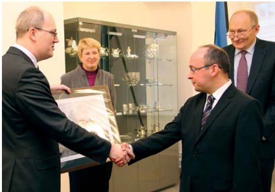
Rahvusarhiivi pidulik üleandmine Haridus- ja Teadusministeeriumile 5. jaanuaril 2012

Vabariigi Valitsus võttis vastu mitu arhiiviseaduse rakendusakti, millest olulisemad on uus arhiivieeskiri ja asjaajamiskorra ühtsete aluste muutmise määrus. Arhiivieeskirja kohaselt keskendub Rahvusarhiiv edaspidi arhiiviväärtusli-