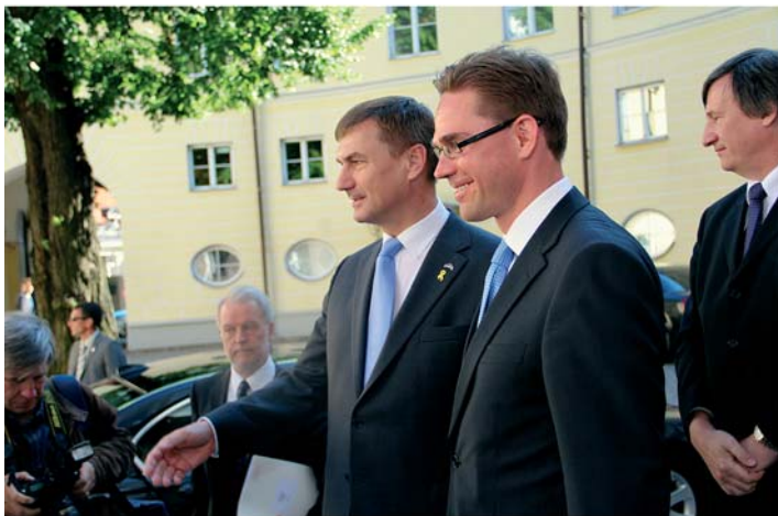
Soome peaminister Jyrki Katainen 27. juunil 2011 Stenbocki maja õuel