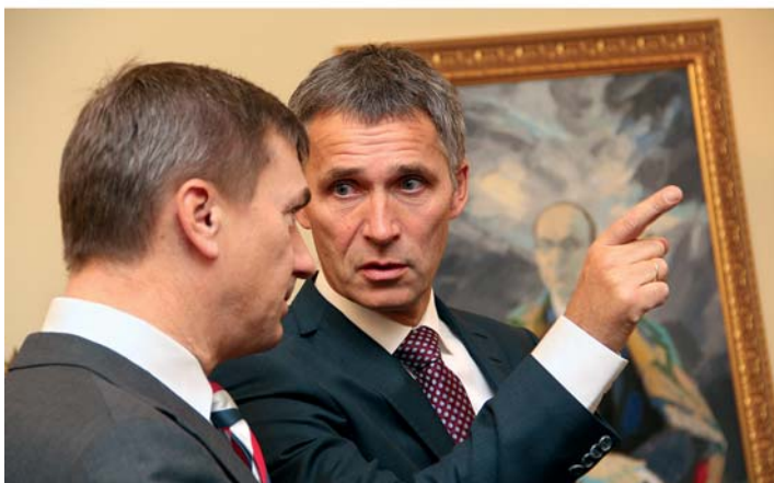
Norra peaminister Jens Stoltenberg 12. oktoobril 2011 Stenbocki maja Riigivanemate saalis