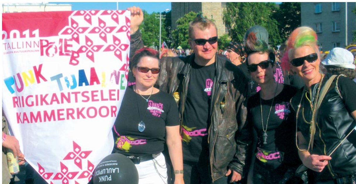
Riigikantselei kammerkoor punklaulupeol Rakveres 11. juunil 2011

Riigikantselei tugiteenuste arendamiseks ja tugiüksuste töö paremaks koordineerimiseks moodustati septembris 2011 tugitegevuste juhi ametikoht.