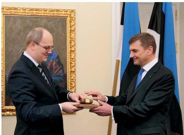
Peaminister kinnitab kõik valitsuse otsused haamrilöögiga. Haamri saab iga valitsusjuht pärast ametiaja lõppu endale mälestuseks. 6. aprillil 2011 Stenbocki maja Riigivanemate saalis