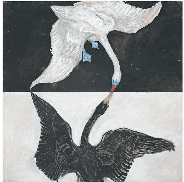
Õlimaal "Luik" aastast 1915.

Ühe aasta jooksul maalis af Klint oma ateljee põrandal kümme paberile kantud teost, mis oma mõõtmetelt võiksid katta kogu tavalise elutoa seina. Vasakul üks neist, 1907. aastal maalitud "Lapsepõlv".