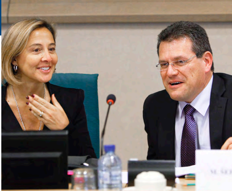
Maroš Šefčovič, Euroopa Komisjoni asepresident