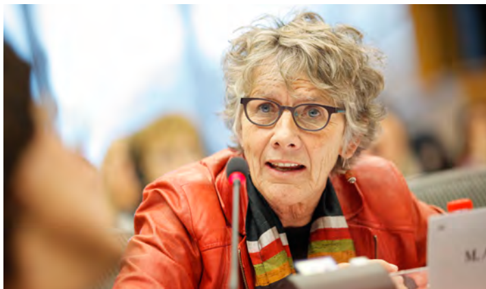
MARGRETE AUKEN (Verts/ALE, DK)

Mis on teie arvates petitsioonikomisjoni kõige olulisem saavutus viimase viie aasta jooksul?