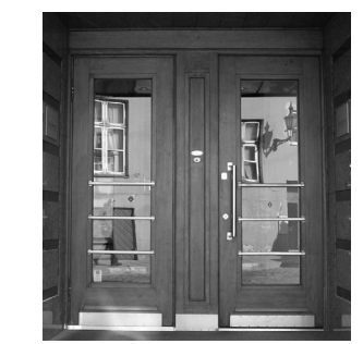
Rataskaevu tn. 7, Tallinn

1920–30-ndatel rajatud hoonete ukсед on funktsionalismile omaselt lihtsavormilised ja siledapinnalised. Esineb ka rahvusromantilisi kujundusi.