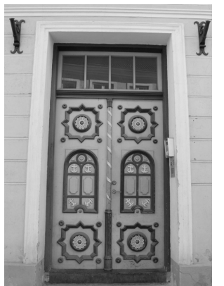
Historitsistlik uks Suur-Karja tn. 3, Tallinn

19. saj. lõpus ja 20. saj. alguses levinud historitsism ja juugend kajastusid ka uste kujunduses.