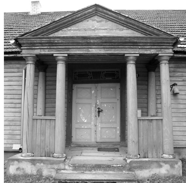
Paide, Tallinna tn. 31

Maja esiuks ei ole pelgalt sissepääs hoonesse, vaid ka omaniku visiitkaart. Uksel on alati olnud täita oluline roll fassaadi ilmestaja ja kaunistajana. Läbi aegade on uks peegeldanud hoone elanike maitse-eelistusi ning ajastule iseloomulikku stiili.