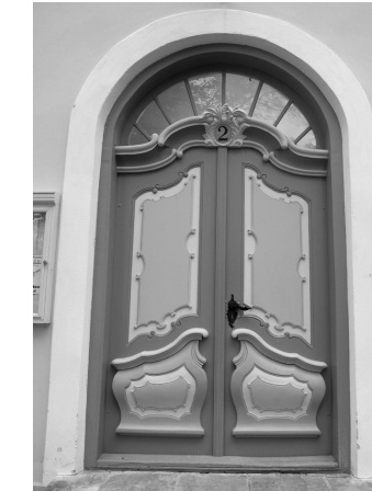
Kooli tn. 2, Haapsalu

17. ja 18. saj. barokkuksi iseloomustab lopsakas vorm nii uksetahvlite kujunduses kui ka sepsidetailide osas. Levinud kujundusvõtteks oli välisukse kohal paiknev valgmikuaken. Ukseleht oli traditsiooniliselt kahekihiline, siseküljel pöönadel asetsev laudkilp ning välisküljel tahveldis.