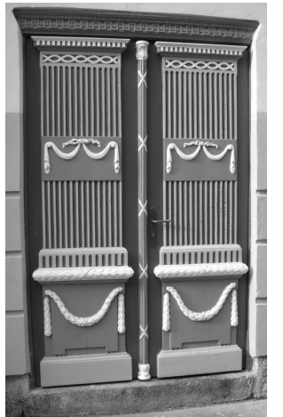
Ülikooli tn. 13, Tartu

Varaklassitsistlikel ustel võib veel üsna sageli kohata barokseid sepsideid.