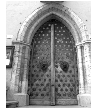
Suurgildi hoone, Pikk tn. 17, Tallinn

Nii võib Tallinna 15. saj. portaalides mitmelgi pool kohata 17. saj. pärit uksti, mida kaunistavad kas kunstipäraselt kujundatud sepanaelad ja koputid (nt. Tallinna Suurgildi hoone) või meisterlikud puitnikerdused (nt. Suur-Karja tn. 1).