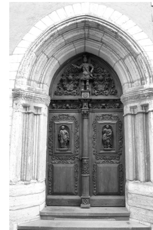
Suur-Karja tn. 1, Tallinn