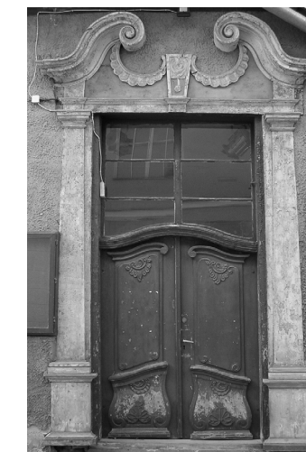
Lutsu tn. 2, Tartu