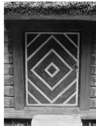
Tõnu talu, Muhumaa, EVM

Alates 19. saj. II poolest, mil saematerjal muutus hõlpsasti kättesaadavaks, hakati uksti katma kas Kald- või kalasahamuustrilise profileeritud laudisega . Lisaks dekoratiivsusele (sageli oli laudis erivärviline), muutis see ka ukse märgatavalt soojapidavamaks ja tugevamaks ning aitas vihmavett hõlpsamini ära juhtida.