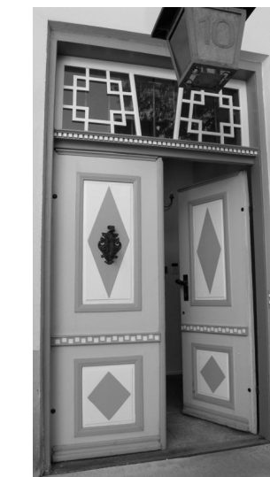
Kohtu tn. 10, Tallinn

Varaklassitsistlikel ustel võib veel üsna sageli kohata barokseid sepsideid.