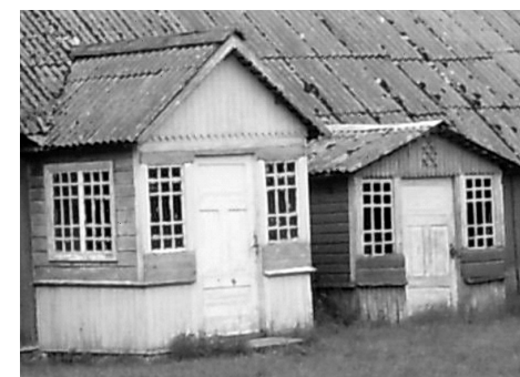
Lääneküla, Prangli saar