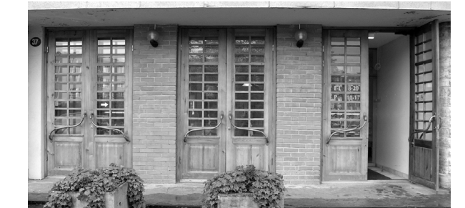
Juugenduksed Vana-Lõuna tn. 37, Tallinn