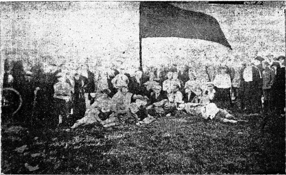
8. Töölisnoorsoopäew. — Meeleawaldajad Pirital

Siin on wäljendatud Pariisi Kommuna kogemused 1871. a. Engels kõneleb siin kodanluse riigi „häwinemisest“ proletariaadi rewolutsiooni teel. Kodanline riik Engelsi järgi ei sure mitte wälja, waid „häwitatakse“ proletariaadi poolt“. Sotsiaaläraandjad ja opportunistid kõnelewad ja püüawad tõendada sootumaks wastupidist.