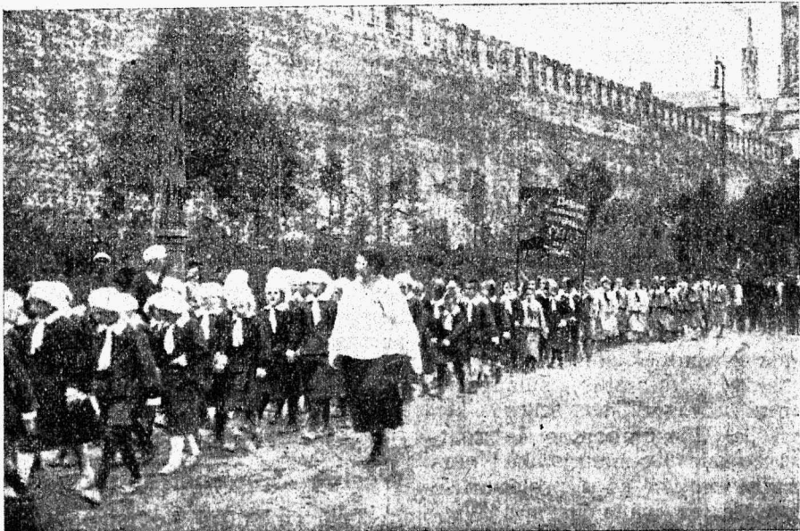
Ü. W. K. Kaswatusmaja kaswandikud 3. sept. 1922 a. Moskwas (Punasel platsil)

ühine töökawa sepitseti. Et noorte enesete hulgast poliitiliste ja kultuurilise teadmistega varustatuid tegelasi kasvatada, moodustati 3-kuuline noorieühingu liigete poliitiline kool, mis rahuldawaid tagajärgi on osutanud. Osa seltsimehi, lõpetades kooi, läksid ühingutesse tagasi, osa läks kõrgemasse kooli edasi õppima. Praegu seab W. K. N. Ü. omale peaülesandeks noorepõlwe ettevalmistamise Nõu-