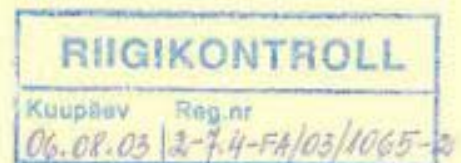
Toivo Maimets Minister