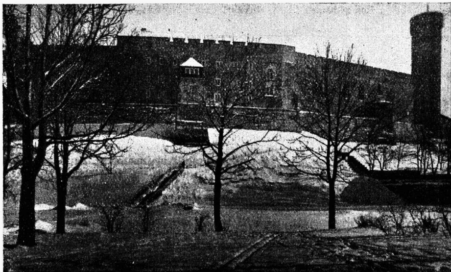
Toompea loss — Vabariigi Valitsuse asukoht.