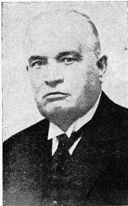
Vabariigi President K. Päts,

kes pühitseb 23. veebruaril oma 65 aasta sünnipäeva.