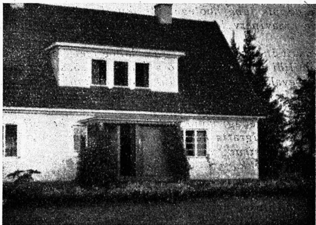
Tobiväät lahtise rõdu kaunistamiseks.