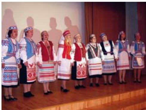
Näiteid naiste rikkalikust rahvarõivakollektsioonist.

Valgevene traditsioonilised rahvarõivad on säravad ja originaalsed. Sajandite vältel on naised oma rahvuskostüüme luues ja rikastades pannud neisse rohkesti tööd, kaunidust ja hinge. Kristlastest valgevenelaste rõivad vastasid kogu neid ümbritsevale ilule, mida ülistasid meloodilised rahvalaulud ja ammustest aegadest pärinevad tantsud. Huvitav ja omapärane on see, et vanasti kanti ikka valgeid riideid, olgu siis tegu pulma või