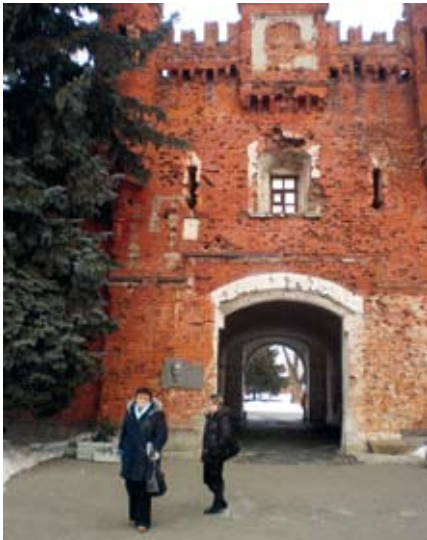
Bresti kindluse väravad.

Bresti oblastist on teada Kamjanetsi torn Belaja Veža (XIII sajand), barokki esindav Karal Baramei kirik Pinskis (XVIII sajand), hilise baroki näide, Pinskis asuv Butrõmovitši loss (1784–1790). Põnevad ehitised on Ružanõ asula paleekompleks (XVII–XVIII sajand) ja klassitsismi elementidega Kossava loss (XIX sajand).