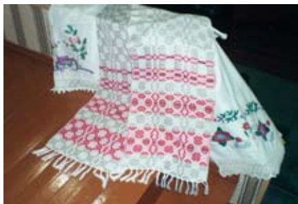
Rahvusliku ornamendiga kaunistatud rušnik.

Muistne kunstiliik on ka tikand. Tikkimiseks kasutati linast, villast või siidniiti. Tikandiga kaunistati nii riideid, peakatteid kui ka jalanõusid ning mitmesuguseid teisi esemeid. Nahast jalanõudele tikiti tavaliselt punase, sinise, roheline ja kollase niidiga. Kullakarva niiti ja samuti siidniiti kasutati enamasti kraede, mansettide ja peakatete kaunistamiseks. Levinuim muster oli valgele põhjale tikitud puna-must ornament.