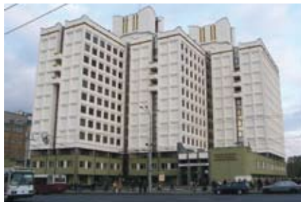
Valgevene Riiklik Ülikool (asutatud 30. oktoobril 1921).