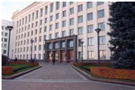
Valgevene Presidendi Juhtimisakadeemia (asutatud 29. jaanuaril 1991).

2003. aastal kehtestati kõigis õppeasutustes senise 5-pallise hindamis-süsteemi asemel 10-palline hindamissüsteem.