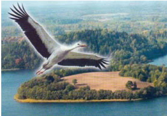
Valgevene kaunis loodus.

Juba XIV sajandi lõpus kuulutas Leedu suurvürst Jagailo uhke pargi kaitsealaks ning keelas seal jahipidamise. Niisiis on iidset metsa kaitsitud juba üle 600 aasta. Tänu sellele kasvab Belaveži puštša rahvuspargis tänaseni ligi 2000 hiiglaslikku puud. Belaveži puštša on kantud UNESCO maailmapärandi nimistusse.