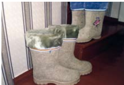
Kuulsad Valgevene vildid.