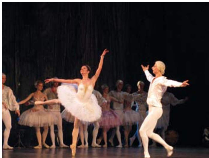
Ballett „Pähkklipureja” Valgevene Riikliku Akadeemilise Suure Ooperi- ja Balletiteatri laval.

Tänases Valgevenes korraldatakse suurejoonelisi teatrifestivale, millest mainekamad on Minskis toimuv „Panorama” ja Brestis aset leidev „Belaja Veža”. Samasse ritta kuulub mitu lavakunstikonkurssi. Gomelis toimuv festival „Slaavi teatrite kohtumised” on regionaalsest teatrisündmusest ammu üle kasvanud rahvusvaheliseks. Lühietendusi kantakse ette Maladzetšnas „Maladzetšnenskaja sakavitsa” festivalil. Minskis korraldatakse regulaarselt nukuteatrite festivali, samuti saab pealinnas ülevaate monoetendustest. Valgevene teatrid on toonud auhindu ka prestiižikatelt rahvusvahelistelt festivalidelt: Edinburgh`i festivalilt Suurbritannias, Shakespeare`i-nimiselt festivalilt Hispaanias, Tšehhovi-nimiselt festivalilt Venemaal ja mujalt.