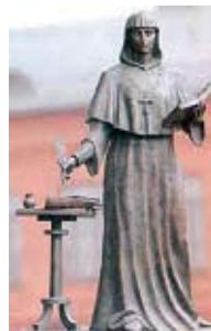
Mälestussammas Eufrašinnja Polatskajale Valgevene Riikliku Ülikooli juures.

12-aastaselt pühitseti ta nunnaks ja kogu oma elu elas ta vaeseid aidates ning kirikute ja kloostrite ehitamisel kaasa lüües. Ta oli esimene naine, kellele vene õigeusu kirik omistas pühaku staatuse. Austusväärne naine ülistas inimeste hingepuhtust ja siirast armastust, kutsus kõiki elama rahu ja harmoonias. Valgustustegevust alustas püha Eufrašinnja raamatute ümberkirjutajana. Ta suri palverännakul Jeruusalemmas.