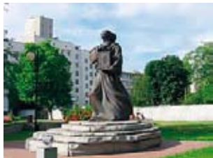
Mälestussammas Kirill Turovskile Valgevene Riikliku Ülikooli linnakus.

Kirjanik-jutlustaja Kirill Turovski (1130–1182) loomingu põhiteemaks oli inimene. Tema kirjanduslik pärand kujunes sedavõrd mahukaks, et teist sellist kirjameest kaasaegsete seast tema kõrvale ei leia.