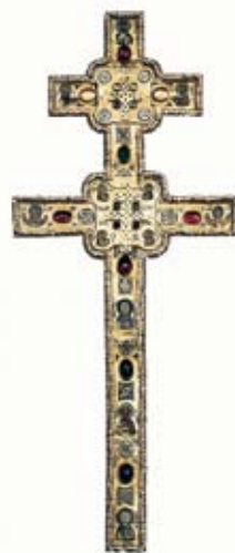
Püha Eufrosinnja rist.

Enamik usklikest valgevenelastest on kristlased: õigeusklikud, katoliiklased, uniaadid ja protestandid. Uniaadi kirik ühendab endas nii katoliiklikke kui ka õigeusu traditsioone ja on seega täiesti omalaadne nähtus. Õigeusk levis Valgevene territooriumile X sajandil: esimene, Polatski piiskopkond loodi 992. aastal. Katoliiklusest võib sealmail kõnelda XIV sajandi lõpust. Protestantluse, luterluse ja kalvinismi algusaastad on XVI sajandis. Jудаismi järgijaid elas sealmail juba IX–XIII sajandil. Islam levis Valgevenes XIV–XVI sajandil.