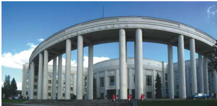
Valgevene Riikliku Teaduste Akadeemia peakorpus Minskis.

Teaduskeskused tegelevad mitmete riiklikku tähtsust omavate valdkondadega: olgu siinkohal nimetatud maavarade töötlemine, energeetika, info- tehnoloogia, keskkonnaseire, kosmosetehnoloogia, meditsiin.