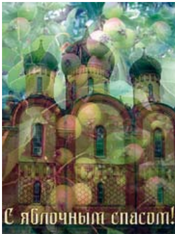
Head Jablotšnõi Spas'i püha!

Seda püha tähistatakse 19. augustil. Nime- tus on tulnud saagijumal Spasi nimest. Alg- selt peeti mitmeid Spasiga seotud püha- sid: näiteks seene-, leiva-, marjapüha. Neist tuntumad olid kolm püha: Mee Spas, Pähkli Spas ja kõige tähtsam – Õuna Spas ( Jablotšnõi Spas ).