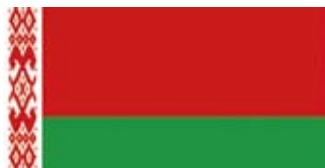
Valgevene Vabariigi lipp.