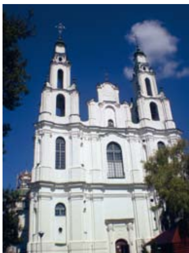
Sofia katedraal ...