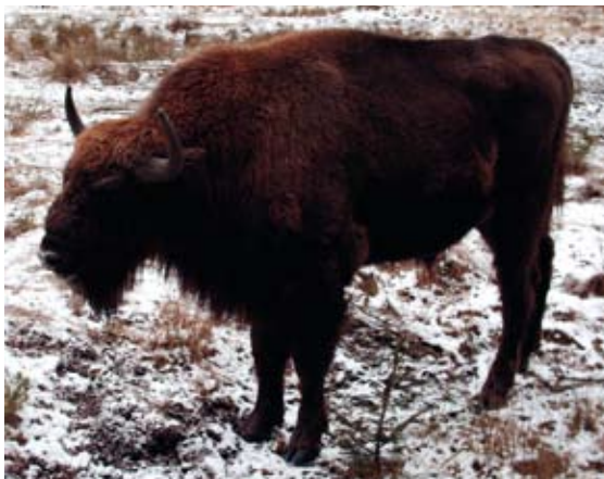
Uhke piison (zubr) – Belaveži puštša ja ka Valgevene sümbol.