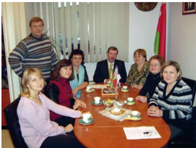
Eesti ja Valgevene õpetajad kohtumisel Valgevene Peakonsulaadis 2008. aastal.