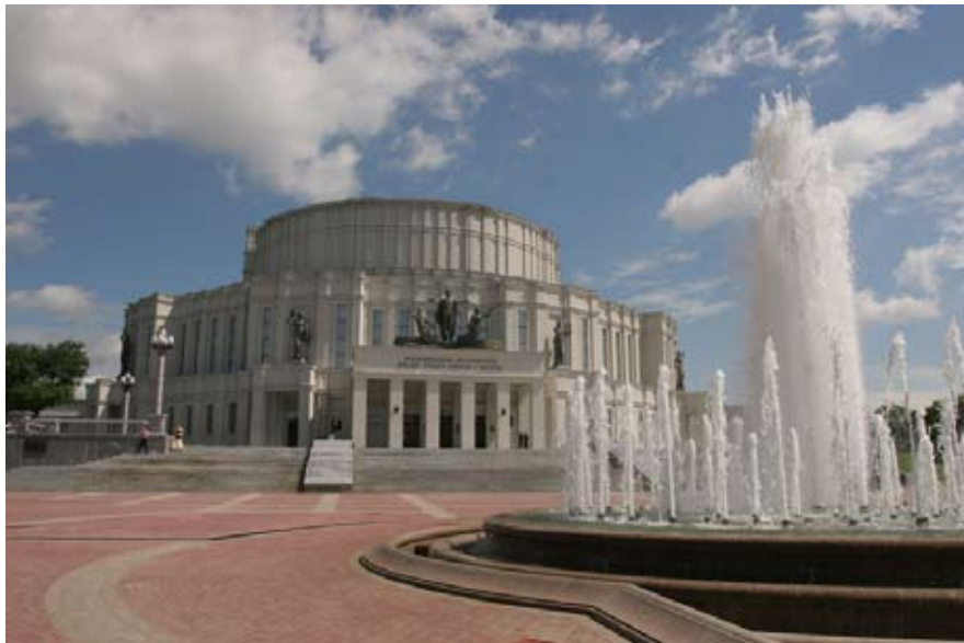
Valgevene Riiklik Akadeemiline Suur Ooperi- ja Balletiteater.

Valgevene teatri juured peituvad väga ammustes kombetalitustes ning rahvuslikes mängudes. Kui esialgu osales neis kogu külarahvas, siis ajapikku kerkisid esile professionaalsed näitlejad – rändmuusikud ja narrid. Neid nimetati XI sajandini väga erinevalt, näiteks gutšõ , pljastšõ ('vilistajad, tantsumehed'), ja nende loomingus võis eristada draama-, muusika-, vokaalseid, tantsu-, tsirkuse-, estraadielemente – seda kuni XX sajandini.