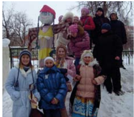
Maslenitsa pidustused Ozertsja külas.

Maslenitsa paneb inimesed kogu hingest lõbutsema, tavaks on korraldada rahvarohkeid pidustusi, mille juurde kuuluvad rahvamuusika ja tantsud. Sel päeval panevad peolised kindlasti selga rahvarõivad.