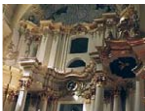
... ja selle sisevaade.