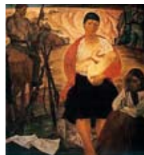
Mihhail Savitski „Partisani Madonna”, 1967.

Aastatega on kunstielu muutunud aina aktiivsemaks. Üha enam korraldatakse näitusi, tehakse koostööd välisriikide kunstnikega, suurenenud on fotokunsti ja arvutigraafika osakaal. Valgevene kunstnikud võtavad aktiivselt osa rahvusvaheliste kunstiturgude tööst. Tänu sellele on nende kunst jõudnud ka Prantsusmaale, Itaaliasse, Saksamaale, Austriasse, Suurbritanniasse, Hiinasse, USA-sse ja mujalegi.