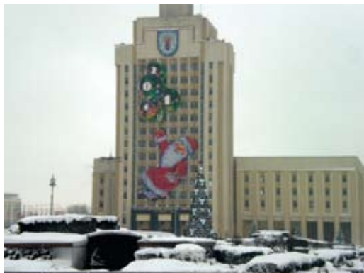
Valgevene vanemaid kõrgkool, Maksim Tanki nimeline Valgevene Riiklik Pedagoogiline Ülikool.

Hariduse andmisest Valgevenes võib rääkida alates X sajandist – ajast, mil Venemaa võttis omaks ristiusu. Valgevenes oli hariduselu samuti seotud õigeusuga ja sellele panid aluse piiskopiteaduskond Polatskis (992) ja Turovis (1005).