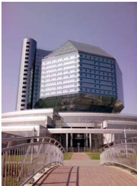
Rahvusraamatukogu uus hoone.