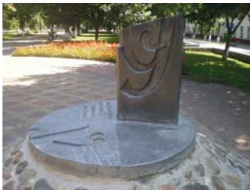
Monument ŷ tähe auks Polatskis.

2003. aasta septembris püstitati Euroopa keskpunktis asuvas vanas Valgevene linnas Polatskis ŷ tähe auks koguni monument. Selle autor on valgevene nimekas skulptor Aleksandr Finski. Savist ja kipsist valmistatud mälestusmärk toimib ka päikesekellana. Iseenesest on monument mõeldud austusavaldusena kogu valgevene tähestikule, eriti on aga esile tõstetud ŷ: just selle tähe reljefne kujutis on mälestise ülaosas eraldi välja toodud.