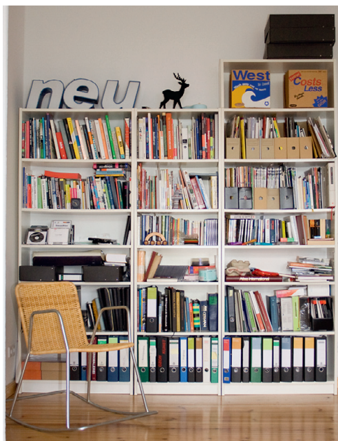
Tehtud ja parajasti käsil tööd sisustavad ühte Marioni kolmest tööruumist.

Ja et mõtted oleksid sisukad, pole ruumides ühtegi juhuslikku mööblitükki. Mõlemad suured kirjutuslaua raamid on otse loomulikult Eiermanni toodang. Kiiktoolid nõupidamisteruumis on firmalt E27 ja lambid Filumenilt. Eriti uhke on Marion oma Frighetto diivani üle – sirge joonega diivan käib mõne lihtsa liigutusega lahti kas tugitoolideks või voodiks – nii nagu parajasti tuju või vajadust on.