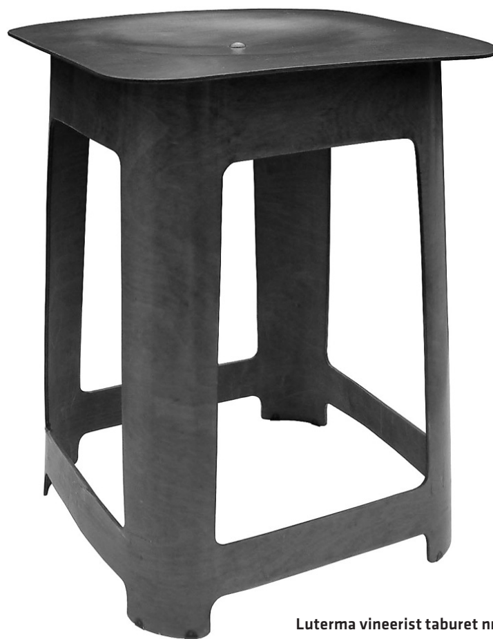
Luterma vineerist taburet nr 2111.

Luterma uudistoodete juures kasutati painutatud vineeri juba toote struktuuraalse materjalina. Uute toodete modernsus ja vormide lihtsus muutsid firma toodangu populaarseks ka disainiteadlikuma elanikkonna hulgas. Luterma töötas välja vineeritehnoloogial põhineva versiooni Alvar Aalto L-kujulisest mööbljalast, mida kasutati toolide ja taburettide valmistamisel. Järjest enam suurenes len-