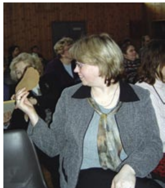
Vaat, mis õpilased välja mõtlesid!