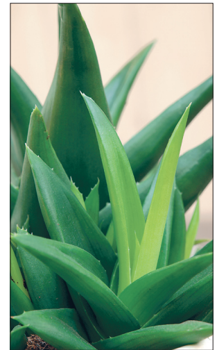
Väikesekasvuliste aaloede hulgas on põnevaid liike ja aretisi.

visehädade puhul. Värsketest lehtede mahlaga saab edukalt ravida mädaseid haavu ja mädapaiseid, suu loputamine aitab suukoopa- ja igemehaiguste puhul.