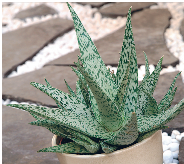
Heledate träpsuliste lehtedega sort 'Snowflake' liigist Aloe rauhii .