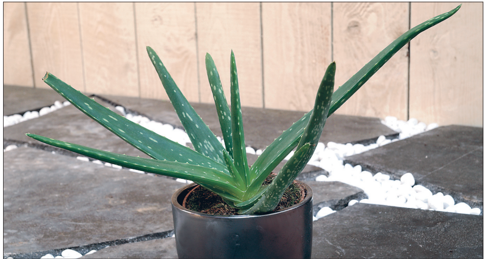
Maailmakuulus ravimtaim harilik aaloe ( Aloe vera ).