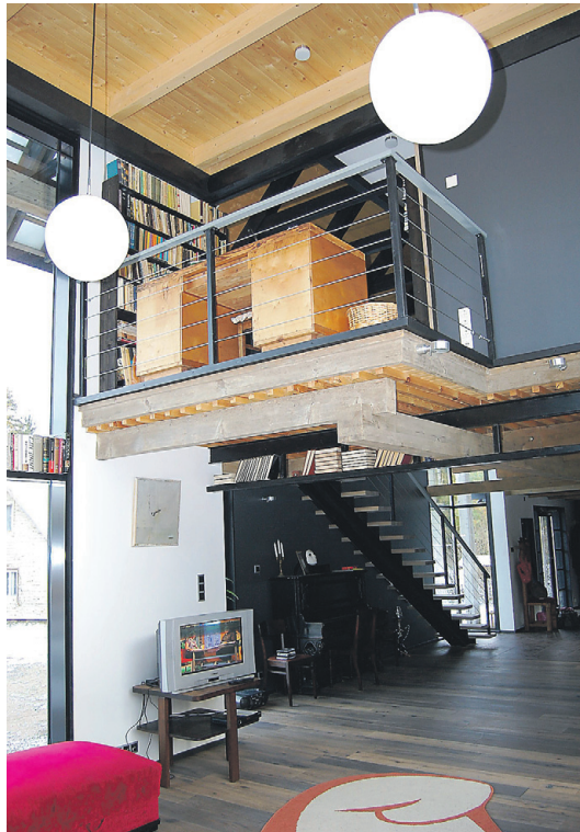
► Napp klaasi-puidusegune ruumikäsitus flirdib ajatute lambikuulide ja massiivsete mööblitükkidega.

Puitkonstruktsiooniga maja toetub osaliselt betoonvundamendile, otsad aga valatud postidele, mis lisab hoonele õhulisust. “Majalust pinnast kõrgendati poole meetri jagu. Vahel olen teinud seda ka paari meetri jagu aga seekord piisas poolestki,” arutles Vaiksoo.