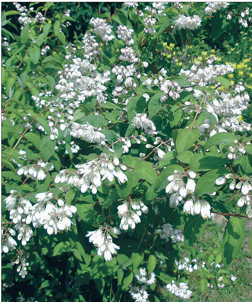
Prantsuse deutsia hakkab õitsema pärast jaani.

Nii juurdumisseguga kui ka õhk pistikute ümber peab olema niiske. Sobiva kasvukeskkonna saamiseks võtke suurem (5–10 l) mineraalveepudel, lõigake kaelaosa maha, asetage pudel põhi ülespoole potile ja oletegi saanud odava minikasvuhoone. Varjulises kohas püsivad õhk ja muld pudeli all niiske, iga päev ei pea kastma ega piserdama.