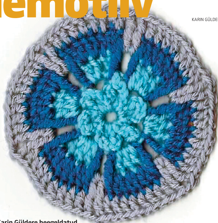
Karin Guldere heegeldatud rukkiililemotiiv.

3 kettsilmust, 5 ühekordset sammast, 1 kolmekordne samm (kinnitatakse teise ringi!), 3 kettsilmust, 1 kolmekordne samm (kinnitatakse teise ringi!), 6 ühekordset sammast, 1 kolmekordne samm... – heegeldage, kuni ring saab täis. Vahetage lõnga.