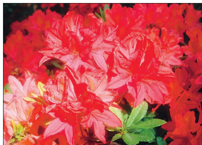
Üks ilusaimaid heitlehiseid Läti rododendroneid on 'Liesma' (liesma on läti keeles leek).