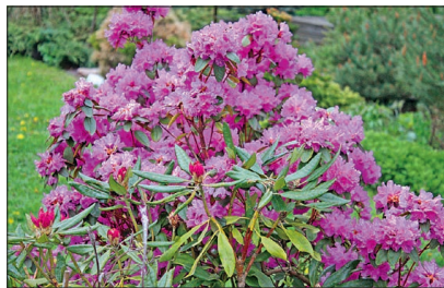
Varane igihaljas õierohke rododendron 'P. J. Mezitt'.