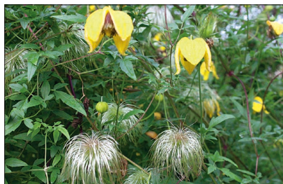
Tanguutia elulõnga sordil 'Bill Mac Kenzie' on õitega võrdselt kaunid ka hõbedased seemnetega suletupsud.