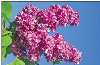
Läti sirelid on kuulsad ka väljaspool oma maad.