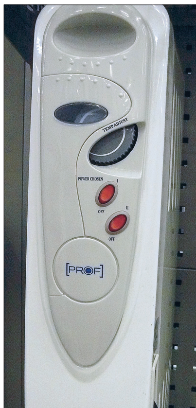
Tänapäevaseid õliradiaatoreid saab mitmel moel reguleerida.

Konvektorid kinnitatakse üldjuhul seinale, kuid müügil on ka jalgadega mudeleid, mida saab lihtsalt tuppa seisma asetada. Maksavad 700–900 krooni ringis.