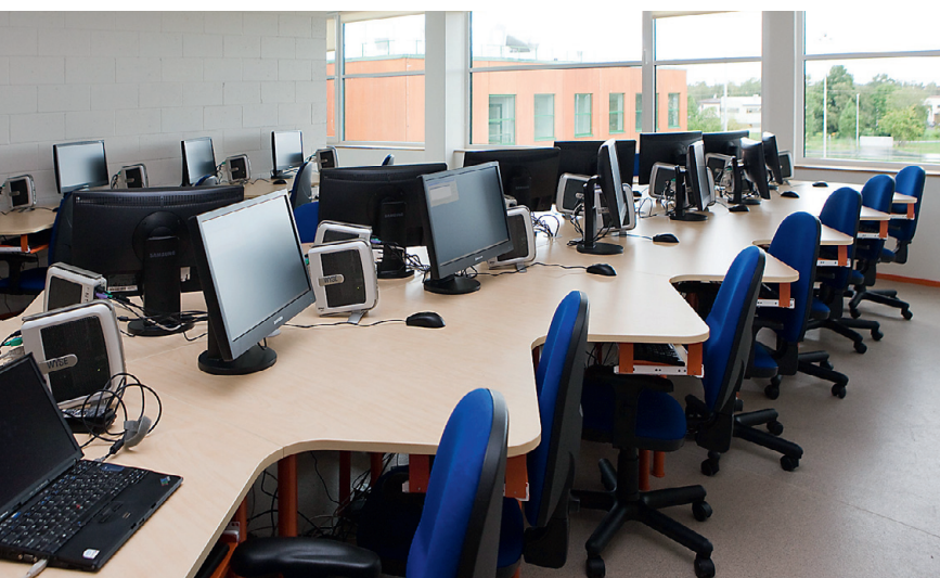
Arvutiklassis jätkub häid masinaid kõigile soovijale.

silmatorkavateks näideteks on koridoripõrandate PVC-kattesse lõigatud keksukastid.