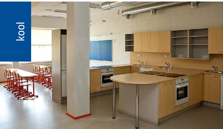
Tütarlaste tööõpetuse klassis saab sööki valmistada neljal pliidiil.