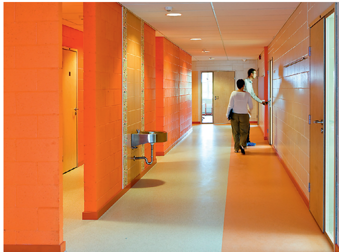
Teise korruse WC- ja jooginurk on oranž, kolmandal sinine.

Oleme ühe ääres juures just seisma jäänud, kui direktor uhkusega joogikraani näitab. Tööpoolest edev – roostevaba kraanikauss sinise seina taustal, piisavalt madalal, et ka esmaklassilised janu