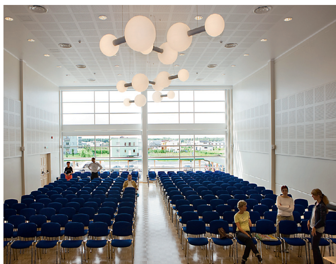
Klaasist otsaseinaga aula lage kaunistavad hiiglasuured valgustid.

kustutama ulatuks. “Mitu kilo see kraanikauss välja kannatab,” pärin direktorit rõõpast välja lüüa püüdes võimalikule kraanikaussi otsas turnimisele viidates. “Oi, sellele pole ma küll mõelnud,” ehmuiski Niinesalu ning tunnen end jubeda pessimistinärana. Edasise ekskursiooni ajal püüan keele kenasti hammaste taga hoida.