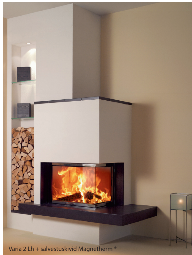
Varia 2 Lh + salvestuskivid Magnetherm®

OÜ Tuli & Vesi Pärnu mnt. 110 11313 Tallinn Tel 679 9391 Fax 679 9390 www.12kaminat.ee