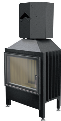
Spartherm Varia 1V+ Thermobox®