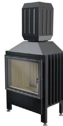
Spartherm Varia 1V + Aquabox®