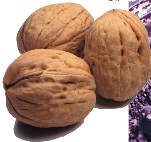
Kui veab, õnnestub ka kreeka pähklist puu kasvatada.

Kuna tegu on lõunamaise päritoluga ja suureks kasvavate puudega, kel vaja talvel ka puhkeperioodi, siis ilmselt neid tubastes tingimustes kasvatada ei õnnestu. Seepärast leidke puu-