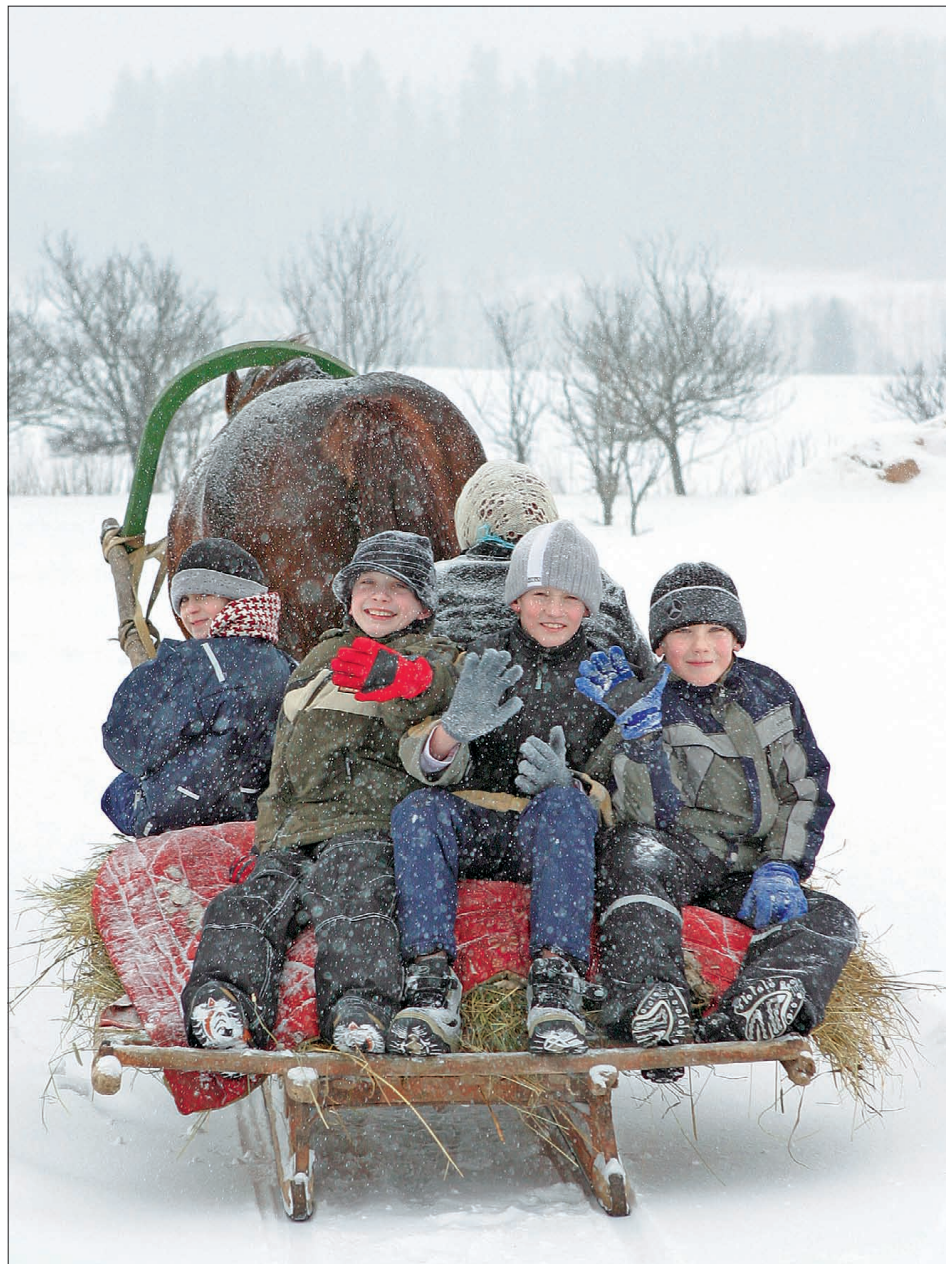
Krootuse põhikooli lapsed vastlasõitu tegemas.