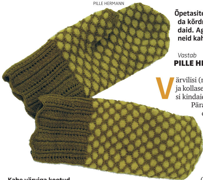
Kahe värviga kootud kõrdmaolised kindad.

Õpetasite, kuidas kududa kõrdmao kirjas kindaid. Aga kuidas teha neid kahe värviga?