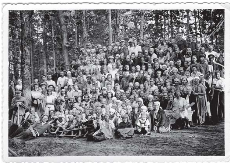
Foto 11. Talgud töid kokku rahvast mitmest kandist. Rahvapargi korrastamise talgud Sindis 1940. a. suvel. Töölised koos perekondadega, käes rehad, labidad jt tööriistad. Foto 1940, Pärnu Muuseum, nr 162.

Jutustaja repertuaari mingil konkreetsel esinemisel mõjustavad mitmesugused asjaolud ja tingimused: koht, kus jutustamine toimus (kodus, töö juures, metsas tulelõkke ääres istudes, kõrtsis jne), kuulajaskond, selle huvialad ja vanuseline koosseis (noorte seas olid käibel teised jutud kui vanadel, lastele jutustati teisi lugusid kui täiskasvanutele), esinemise olukord (nt videviku pidamine, talgud, pühade aeg jne), jutustaja enda kalduvused ja huvialad (mõni teadis eeskätt