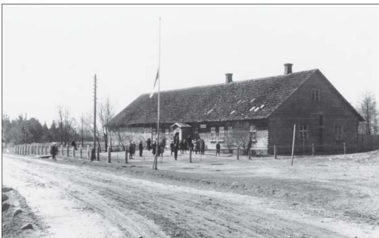
Foto 5. Endine Häädemeeste mõisakõrts. 1937, nr 1672.

Kõrtse oli mitut tüüpi – külakõrtsid, mõisakõrtsid, kirikukõrtsid jne. Rahvale lähemal olid neist külakõrtsid. Kõrtsid olid ka reisijate