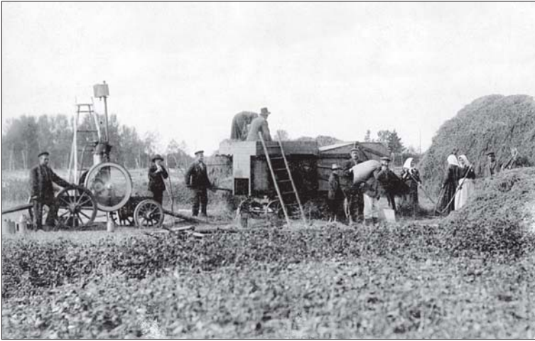
Foto 19. Rehepeks Jaan Lille Kooli talus Ertsmaal. Foto Pärnu Muuseum, nr 3113/1a.

150/1). Näib siis, nagu oleks seegi algselt jutustatud pealtnägija silmadega nähtuna.