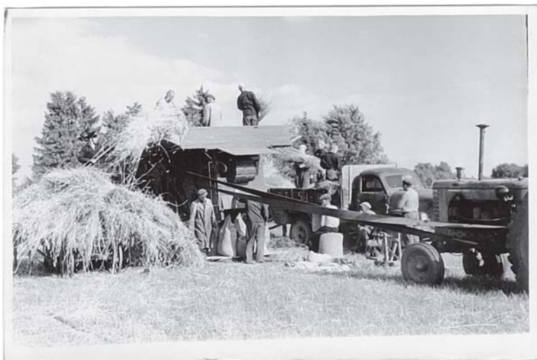
Foto 18. Kui mitmetes vanemates rahvajuttudes oli rehepapp kesknõu kuju, siis nüüdseks on tema ametikoha tähtsus unustusse vajunud ning juttudeski esineb ta järjest harvemini. Rehepeks Ühenduse kolhoosis.