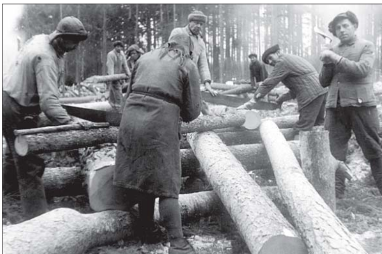
Foto 4. Metsatööde juurde on kuulunud ühine tubane õhtutundide veetmine, mis sageli sisustati jutustamisega. Pärnu linna TK kommunaalosakonna töötajad metsatöödel. Foto 1946, Pärnu Muuseum, nr 2637.

anti süüa! Ja aja juttu edasi! Ja siis selle kaudu siis sai – seal on igasuguseid jutumehi.