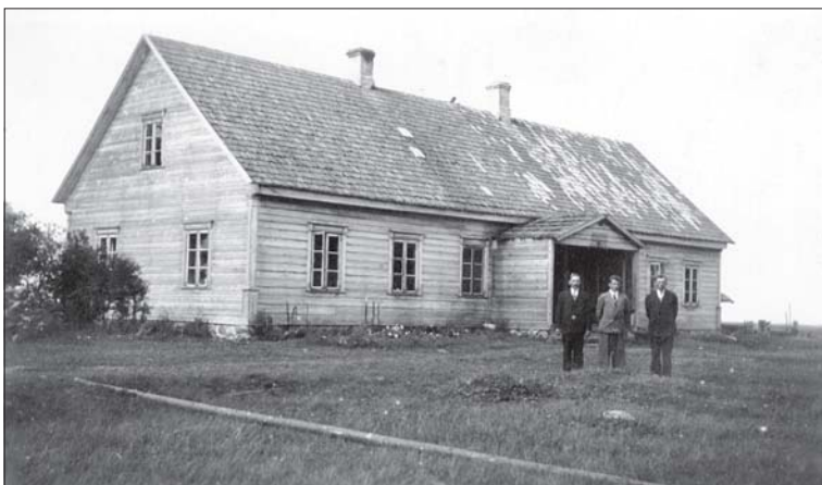
Foto 6. Metsapoole (Treimani) kool Häädemeeste kihelkonnas. Foto 1932, Eesti Rahvaluule Arhiivi fotokogu, nr 2754.

Õhtuti lubati vähe küünalt põletada. Et “põhku pugedes” uni kohe peale ei tulnud, saadeti aega mööda mitmesuguste juttude vestmisega (Prants 1937: 120).