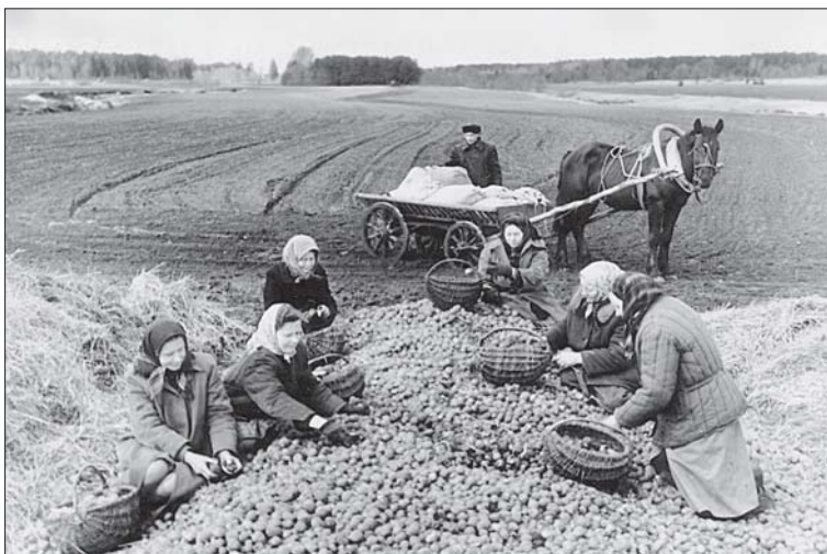
Foto 12. Tihti on jutustamine toimunud paralleelselt tööga. Töö Audru sovhoosi kartulipõllul 1957. aasta kevadel. Foto 1957, Pärnu Muuseum, nr 1830/76.

1956). Setu muinasjutuvestja Veera Vanaküla sidus endale puhta põlle ette ning võttis sukavardad näppu, kui hakkas rahvaluulekogujale muinasjutte vestma (ERA II 194, 24/5 < Setu – Ello Kirss (1938)).