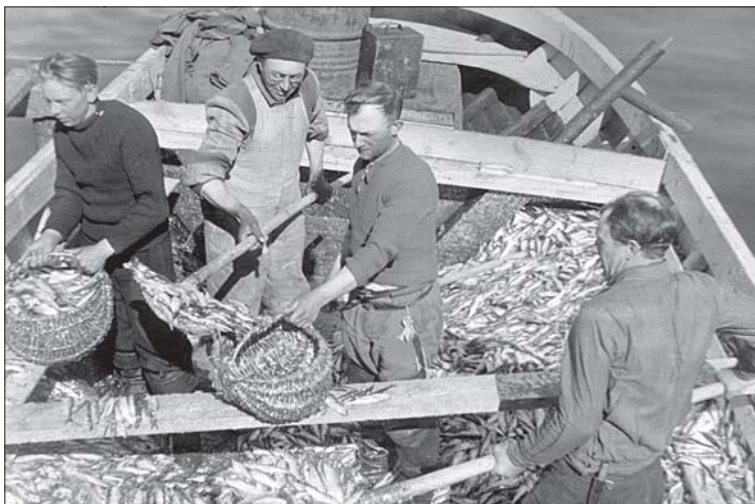
Foto 2. Vanasti on püütud suurt kalasaaki tagada nii maagia abil kui jutuvestmisega, tänaseks on see funktsioon hääbunud ning tuntuim kalandusega seotud jutuliik on liialduslik “kalamehejutt”. Seliste kalurikolhoosi Randlane brigaad annab vastuvõtupunktis üle rikkalikku saaki. Foto Pärnu Muuseum, nr 2805/1.

Rohkesti andmeid selle kohta on Loode-Venemaalt, Laadoga ja Äänisjärve ümbrusest. Seal on võetud kalastajate kollektiivi mõni tuntud laulik-jutustaja nimelt selleks, et ta laulaks staarinaid [= böliinasid] ning jutustaks muinasjutte ning teistel oleks lõbusam töötada; jutustamise ja laulmise eest võis ta saada osa saagist, nagu oleks ta püügist osa võtnud ( Russkoje narodnoje poetišeskoje tvortšestvo 1955: 197 jj;