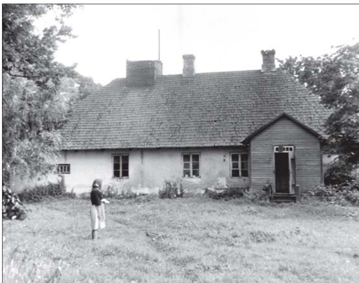
Foto 15. Kõrtsijutustajatele on esinemise eest ostetud õlut ja viina. Endine Sääritsa kõrts Kodavere kihelkonnas.