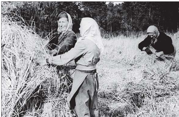
Foto 7. Õhtutunnid võis sisustada ka argijutustamine – lood juhtumustest, mis kogetud igapäevaelus, raskel põllutööl. Töötajad Partisani kolhoosi rukkipoollul. Foto 1962, Pärnu Muuseum, nr 1825/227.

Videvikupuhkus oli tingitud kõigepealt väga pikast tööpäevast. Ketrajate tööpäev algas hommikul õige varakult ning kestis hilja õhtuni. Et hoolimata väsimusest ja töö monotoonsusest õhtul kauem vastu pidada, peeti pimeduse saabumisel lühike puhkepaus: võis veidi pikutada, uinaku teha, võis vestelda või teha vahelduseks külaskäigu naabrite juurde. Kes olid huvitatud jutuvestmisest, need kogunesid sinna, kus oli mõni parem või osavam jutustaja. Jutuvestmine toimus pimedas toas; pimedus lõi jutustamiseks soodsa atmosfääri – igasugused fantastilised ja ebatõenäolised lood kõlasid pimedas usutatavalt ning jäid kuulajatele hästi meelde. Teadlikult valitud põnev jutuaines-