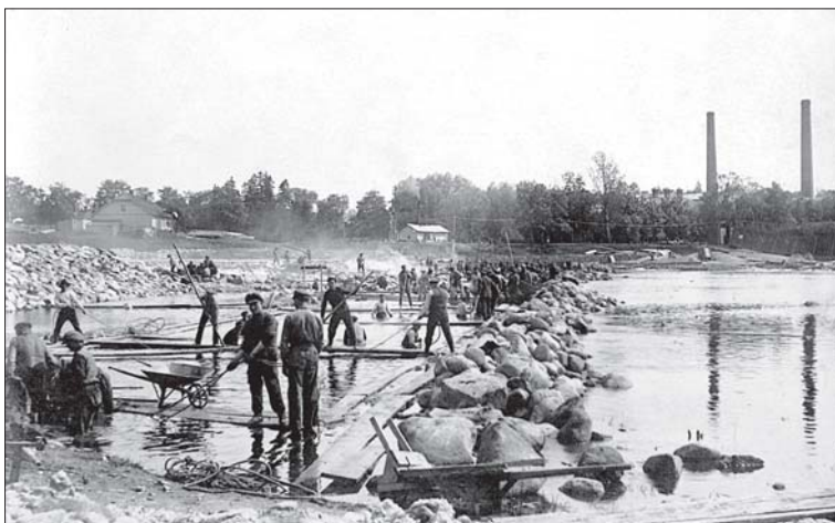
Foto 8. Suuremad ehitustööd töid kokku mehi erinevatest piirkondadest. Sindi pais ehitusjärgus. Foto 1928, Pärnu Muuseum, nr 3390/3.

sisemaa poole, sügisel jälle tagasi – tähendasid ka rahvajuttude rännakut (nt Suure Tõllu lugude ülekandmine saartelt mandrile jm).