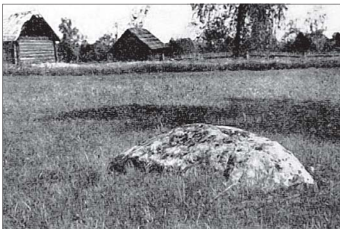
Foto 20. Soendkivi Karilatsi külas Kurvitsa talus.