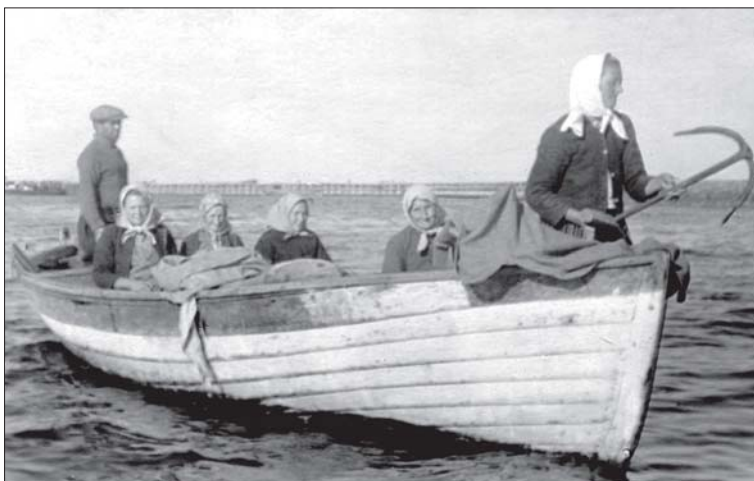
Foto 9. Veeäärsetel rahvastel on kalapüük oluliseks elatusallikaks ning ka jutupärimus on tihedalt seotud veekogude ja kalandusega. Kihnu naised saavad kalapüügilt. Kalapaat, milles neli naist ja üks mees. Foto Pärnu Muuseum, nr 2470.

võrreldavaid paralleele Siberist (ka kiviaegseist haualeidudest Baikali basseinis) ja mis näivad olevat kuulunud šamaanidele või on seostatavad jahindusmaagiaga (Jaamits 1961: 68 jj), siis võivad niisugusedki faktid olla kinnituseks, et aastatuhandete eest on mõned jahindusrahvastele omased uskumused ja tavandid olnud levinud väga laial alal.