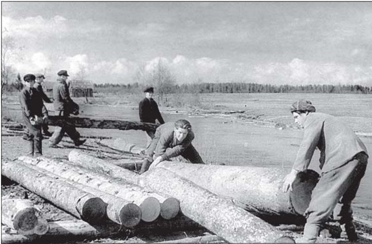
Foto 16. Palgiparvetajate ühised õbbimised pakkusid võimalusi võistutustamiseks. Palgiparvetus Pärnu jõel ja selle harujõgedel. Palkide jõkke lükkamine. Foto 1956, Pärnu Muuseum, nr 1793.

Umbes niiviisi on tööpoolest võidud jutustada Kalevipoja-muistendeid teeparandajate õhtusel laagritulel 19. sajandi algul.