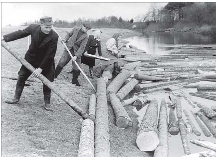
Foto 1. Pärast päevatööd on palgi parvetajate öölaagrites räägitud elust-olust ja vestetud rahvajutte. Tahkuranna valla Kaljuranna kolhoosi töölised Surju jõel parvetustööl. Foto 1950, Pärnu Muuseum, nr 1891/6.

Rahvajuttude esitamine erineb oluliselt rahvalaulude esitamisest; rahvalaule võib laulda ja lauldaksegi ka üksinda olles, kuid jutustamine eeldab tingimata kuulajate olemasolu. Minimaalselt on jutustamisel vaja kahte isikut – jutustajat ja kuulajat. Ühest või mõnest üksikust kuulajast on siiski vähe selleks, et jutustamine areneks hoogsalt ja kaasakiskuvalt. Hea jutustamise parimaks eelduseks on arvukas üksmeelne kuulajaskond. Jutustamist võib põhjustada või soodustada ka vajadus ajaviite järele, jõudeolek, igavustunne, eriti õhtuti.