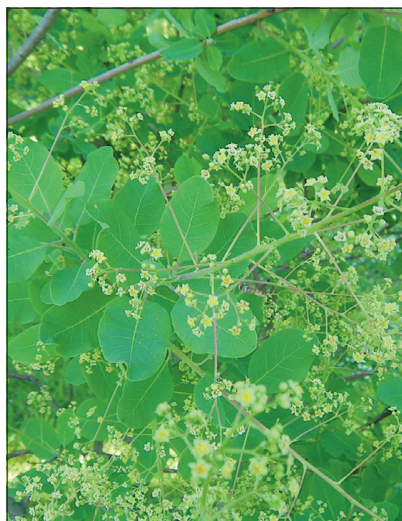
Parukapuu õied puhkevad juuli algul.