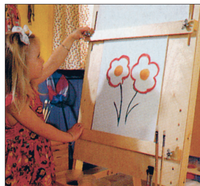
Pildi asukohta saab vertikaalsuunas muuta.