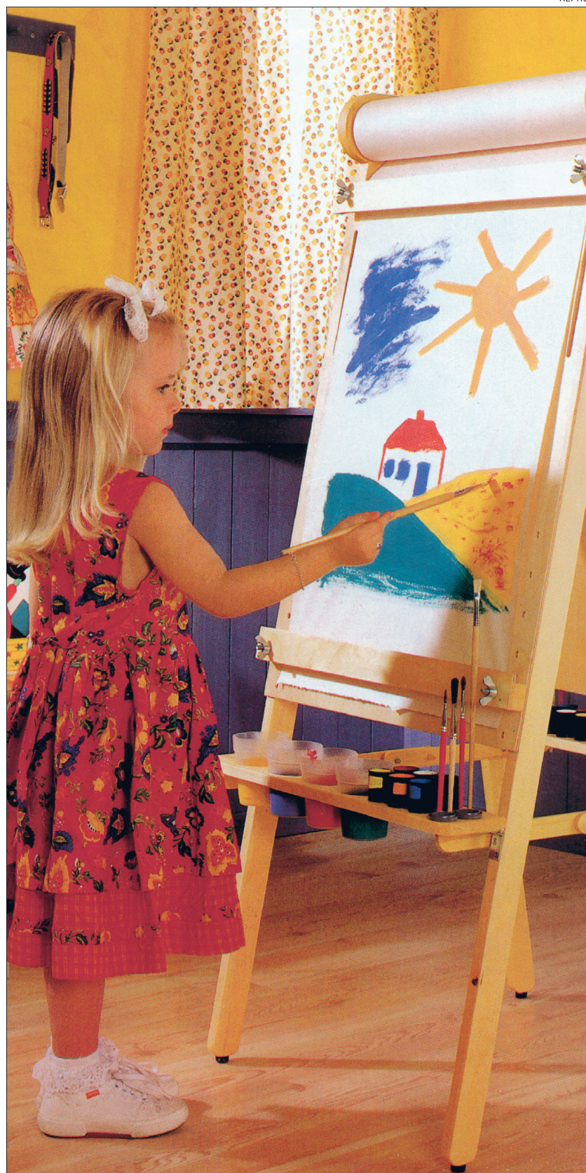
Molbert sobib nii suurtele kui väikestele.

Kahe poolega molbert on hea vahend peres, kus kaks maalimist või joonistamist harrastavat inimest.