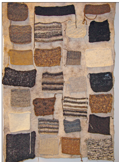
Tööproovid eri lambatõugude villast kedratud lõngadest.