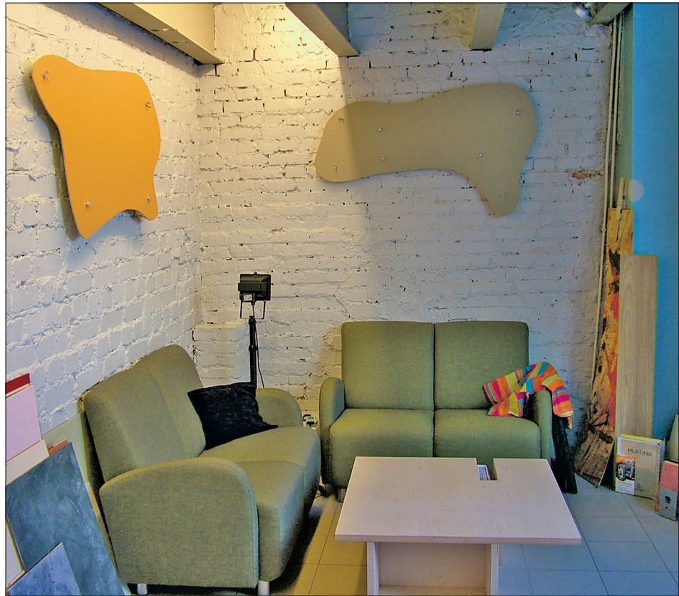
Telliskiviseina on küll tülikas viimistleda, kuid lõpptulemus on põnev, omanäoline ja kordumatu.

“Sisekujundajal on oskus sobitada kokku palju kummalisena näivaid asju, mis lõpuks jätab suurepärase mulje. Kui koduehtija paneb kokku palju ilusaid asju ja kui neid liiga palju saab, võib tulemus tulla midagi muud kui loodetud.”