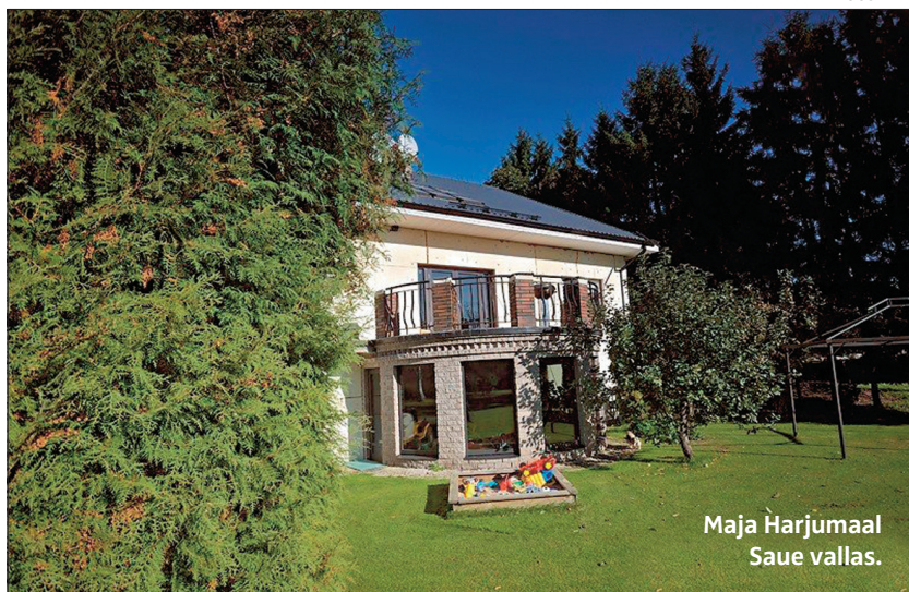
Maja Harjumaal Saue vallas.

Maade ja majade kinnisvaraturg on hooajaline, kevaditi kasvab huvi ja aktiivsus kruntide, suvilate ja maamajade vastu. Pärast jaanipäeva, kui on ilusad ilmad, turg rahuneb, kuna paljud puhkavad. Suve teiseks pooleks on taastunud tavaline ostu-müügi rütm. Talve saabudes väheneb huvi kruntide, suvilate ja maamajade vastu suuresti: raske on osta krunti, mis paksu lume all.