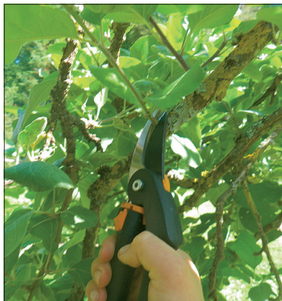
Lõikamisel jälgige kääride asendit – lõiketera peab olema puu poole.