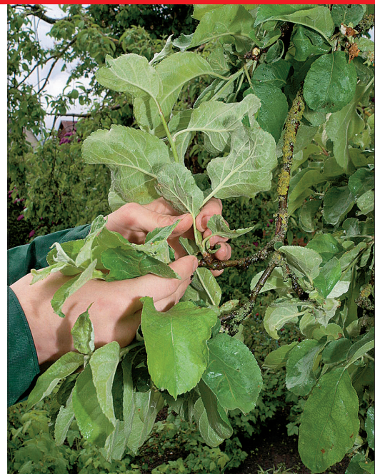
Rohtne aastaskasv tuleb kinnituskohast kergesti lahti, sellepärast on neid mugav käsitsi murda.

Oks tuleb maha saagida tüve ligidalt oksakrae pealt, siis kasvatab puu haava kenasti kinni. Oksakrae on paksendus oksa alguses, oksa ja tüve ühenduskohas.