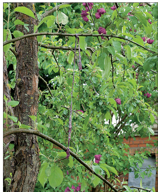
Horizontaalsel oksal tekib rohkem õiepungi. Noori oksa saab rõhtsaks painutada ka nii.