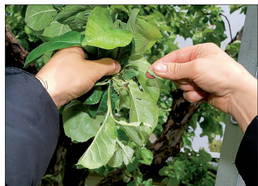
Viljakobara harvendamisel jätke alles kõige ilusam õunahakatis.

Tulen hea meelega appi ja õpetan lõikama, kui keegi soovib oma viljapuid edaspidi ise hooldada-kujundada.