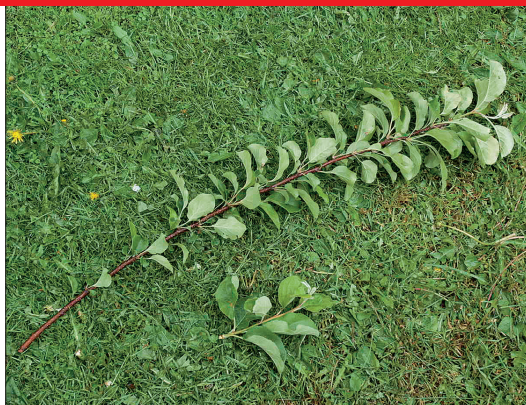
Mullune pikaks kasvanud puitunud kasv ning tänavune kasv juuni algul.