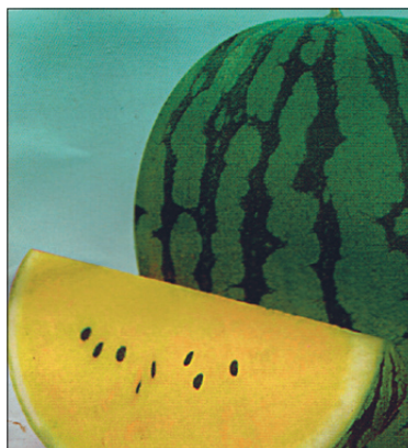
'New Hope' F 1 .

tamise kogemused tegelikult alles puuduvad. Kuid kuna muud omadused peale koore ja sisu värvuse on samad mis sordil 'Typhoon', on alust arvata, et ta meile sobib. Saagikas, väga hea haiguskindlusega.