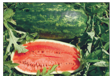
TT 'Typhoon' F 1 .

Kasvuhoones kasvatades võite külvata nädal-paar varem.