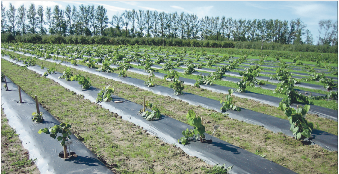
Musta peenrakilega kaetud istutusread Rõhu katsestandikus.