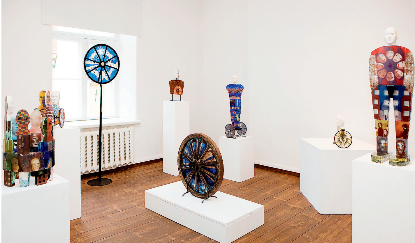
Klaas aja teenistuses. Rait Präätsi mitmekihilistes skulptuurides kaalutakse ajaratta keerlemise kiirust.