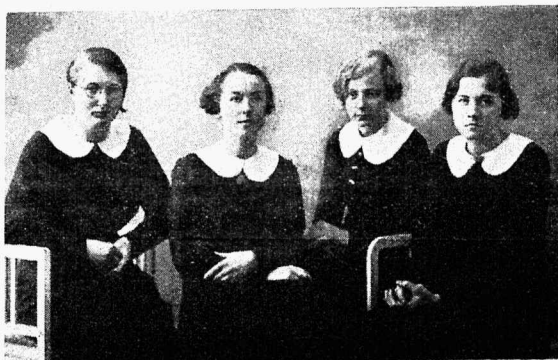
T.T.G. ja T.T.K. Õpilasp. Esinduse juhatus:

Sel õppeaastal kuni käesoleva Õpilaspere aastapäevani on peetud 6 koosolekut, neist 5 referaatkoos-