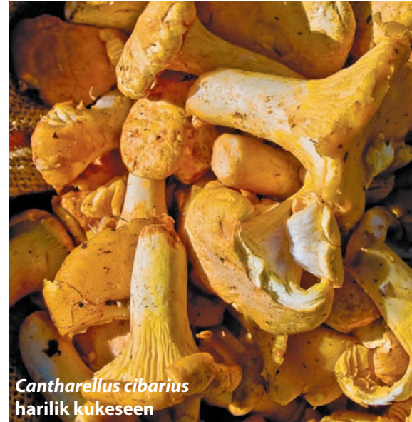
Cantharellus cibarius harilik kukeseen

Tõenäoliselt teab iga loomapidaja, kuidas kutsikad ja kassipojad pärast keemiliste preparaatidega tehtud ussi-kuuri põevad. Ja seda just siis, kui kuuri tehakse esmakordselt. Põhjuseks pole mitte ainult preparaadi toksilisus (kuigi ka see mängib oma rolli), vaid eeskätt asjaolu, et rohke invasiooni puhul ei saa noore looma seedesüsteem parasiitide lagundamisega hakkama. Nii väljutavadi nad pärast parasiitidevastast kuuri terveid usse ja hulgaliselt lima ning on mitu päeva loiud, vaevas ja haiglased. Seentega tehtud kuuri puhul pole märgata mingit põdemisperi-