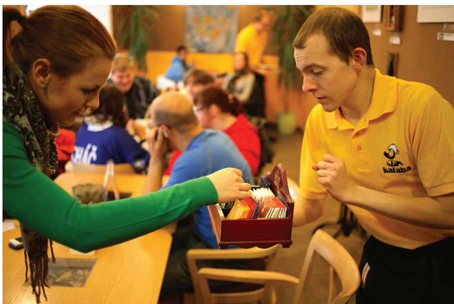
Center of Diakonia ECCB

Solidaarsusgrupp näeb kogukonna diakoonias uute kaasamise meetodite õpetamise vajadust. Pastorite koolitamisel on oluline rõhutada kogukonna diakooniat. Olemas on häid riiklikke ja rahvusvahelisi õppeprogramme ja nii, nagu kogemuste jagamist ja võrgustike loomist teoloogilise hariduse juures LML-is rõhutatakse, nii peab ka diakooniatöös innovaatilisi meetodeid rõhutama. Õppemeetodid ning kogukonna diakoonia mudelid ja lähenemis-