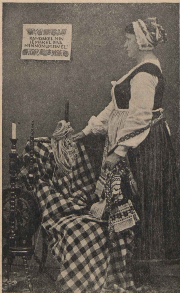
Līvõ toutōrōnd Tartu muzejs (bīlda pāl Rozal Dziadkovski).