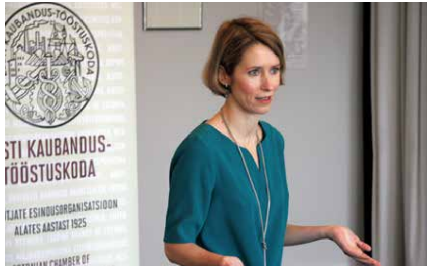
Kaja Kallas Pärnus

15. aprillil kohtusid Pärnumaa ettevõtjad Kaubanduskoja ärihommikusöögil Rannahotellis Riigikogu majanduskomisjoni esimehe Kaja Kallasega. Jutuks oli seadusloome ja eetika Riigikogus, samuti haldusreform ja aktuaalsed päevapoliitilised küsimused.